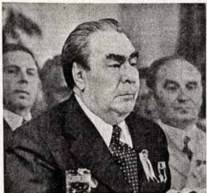
Торжественное заседание в Минске. На трибуне — товарищ Л. И. Брежнев.

Сегодня, сказал он, трудятся столицы Советской