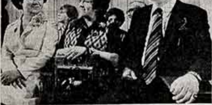
Члены жюри конкурса вокалистов народные артисты СССР М. Визу, Е. Чадар и А. Олешинцев.

Но и на нынешнем конкурсе от Советского Союза представляются 23 участника — очень разные музыканты по своим творческим индивидуальностям, по художественным принципам, по человеческим натурам (я человеческий характер, неотделимый от искусства, которому служим). Вместе с тем все они воспитаны в традициях, заложенных корифеями отечественной культуры, отмеченные глубиной прочтения музыки, сохранением ее певучей, мелодической природы и ее красоты, духовной насыщенности, одухотворенности исполнения. Думается, что в