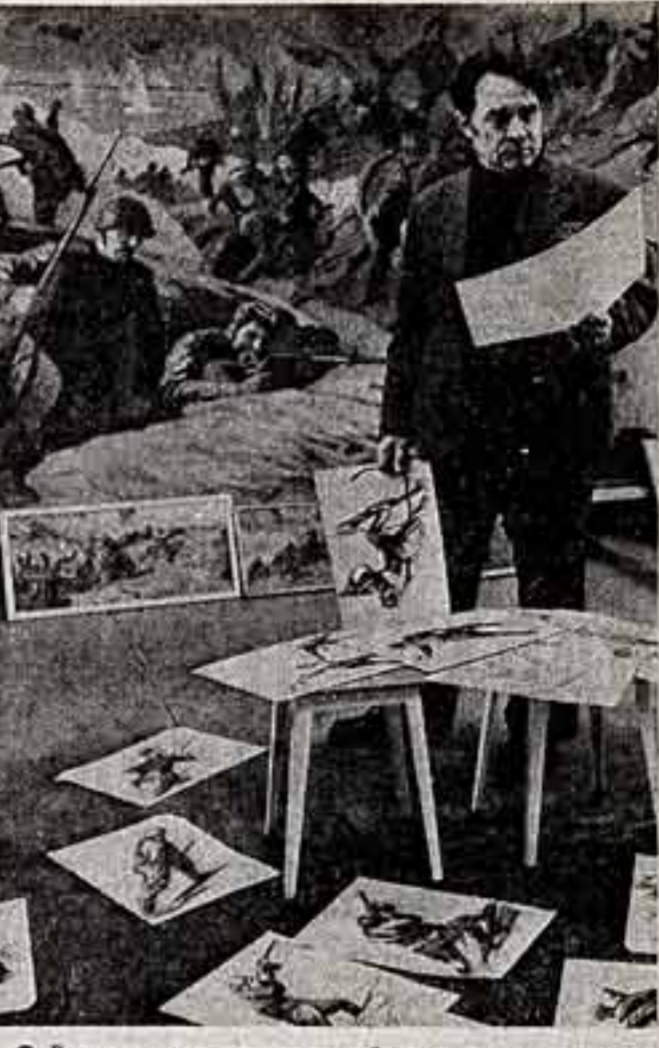
Военная тема занимает видное место в творчестве художника из Графской области Васильевича Пушкина. Она близка ему, бывшему фронтовику, который в годы войны был воеводой в партизанском отряде. В последние работы художника отчетливо видна его любовь к патристике, портреты воинов, героические сцены Великой Отечественной войны.

Рубрикой «Круг чтения» опубликован обзор литературы, выпускаемой издательством «Молод» для трудящихся села.