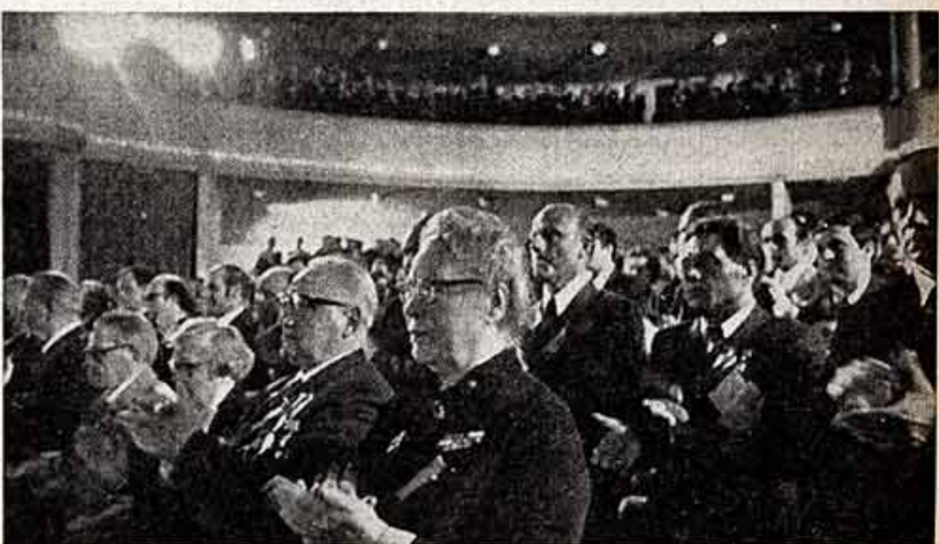
Телефото след. корр. ТАСС В. Мусальмана и В. Кошевого.

Белоруссии города-героя Минска, весь белорусский народ переживают волнующее и радостное событие. Мы безмерно счастливы и горды тем, что для вручения высоких наград Родины — ордена Ленина и медали «Золотая Звезда» — в наш город прибыл Генеральный секретарь Центрального Комитета Коммунистической партии Советского Союза, Председатель Президиума Верховного Совета СССР, выдающийся деятель международного коммунистического движения, активный борец за мир и разрядку международной напряженности, гаубокоуважаемый товарищ Леонид Ильич Брежнев.