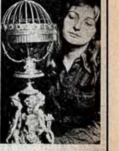
Всемирные часы XIX века, принадлежащие известному мастеру из Оломоуца Розефу Рабду.

В старинной крепости Штарбери близ Оломоуца находится единственный в Чехословакии и один из крупнейших в Европе музей часов.