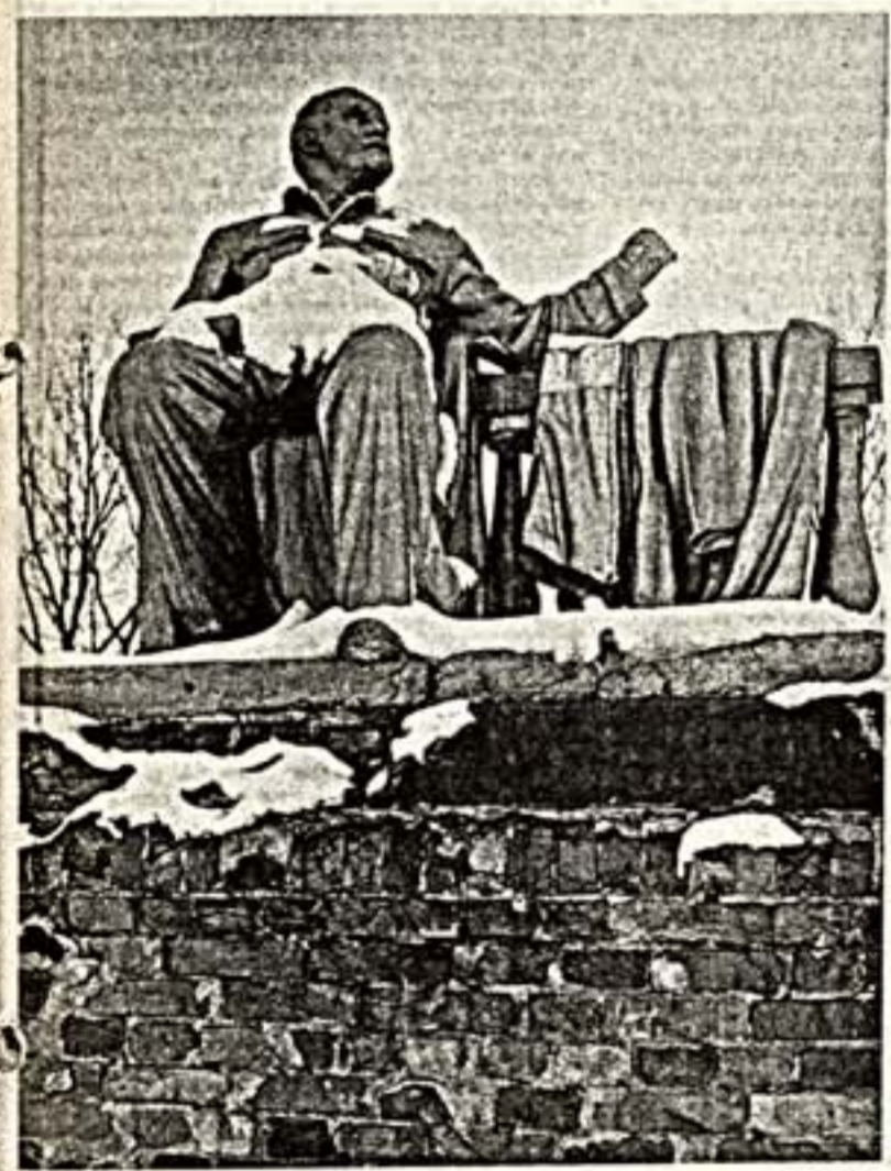
НЕТ НИ БОГА, НИ ЦАРЯ

Предполагая, что жители какого-то одного городского района уже могут договориться о том, что в этом районе не нужно строить зоопарк. Но как договорится несколько миллионов жителей большого города, что, как и где нужно строить? Как связать стратегические задачи с сиюминутными эгоистическими? Как соединить интересы жителей того или иного района и вопреки их с общегородскими? Если этого не сделать, на городской территории будут функционировать лишь отдельные волости и хутора — и только.