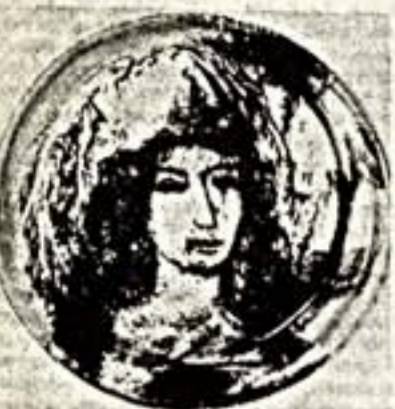
Воспоминания о Рембрандте. Демонстрационная тарелка.