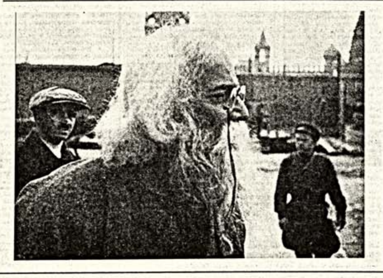
Интервью взяла А. БЕГУНОВА.