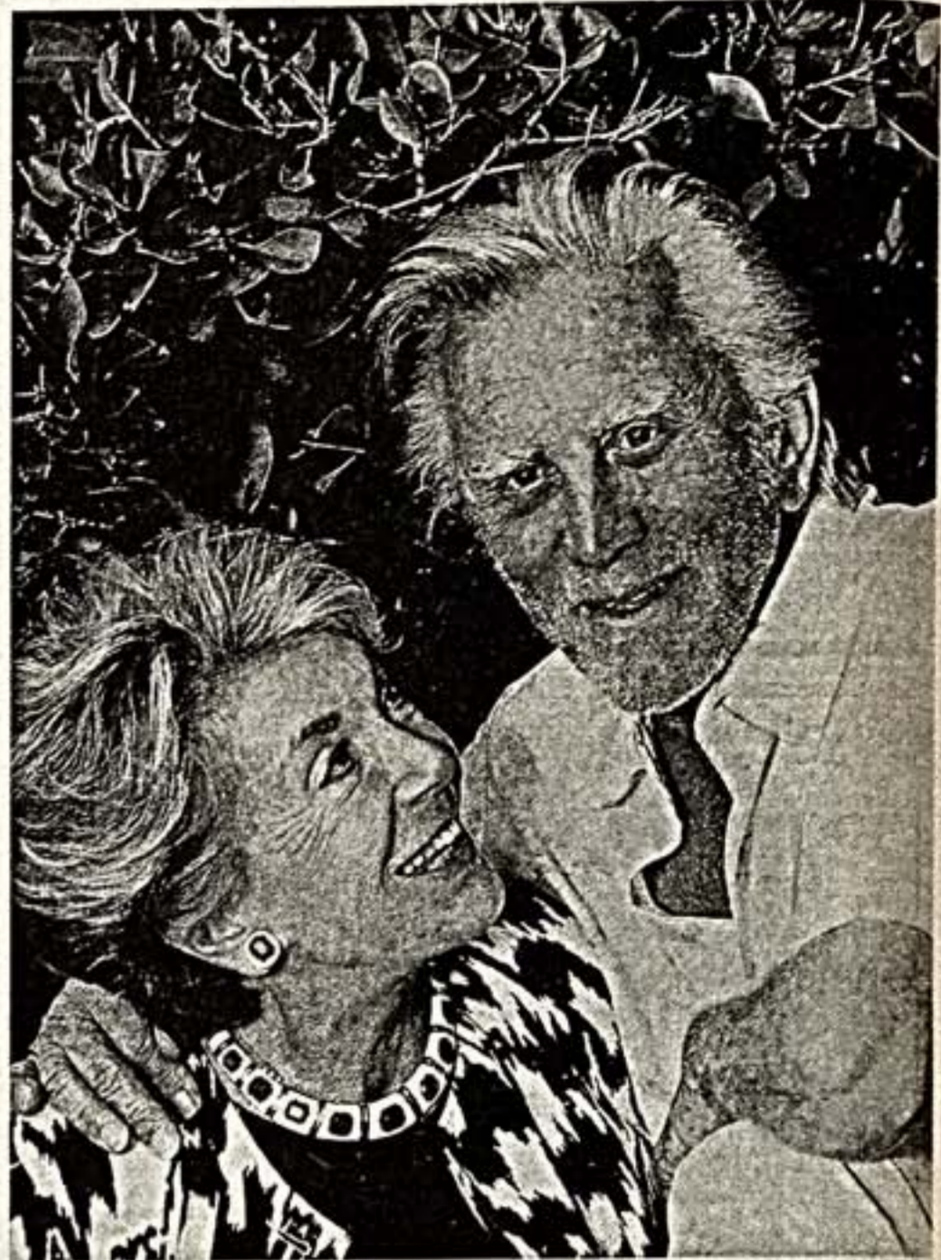
Керк Дуглас с женой Анжелой Хьюстон.