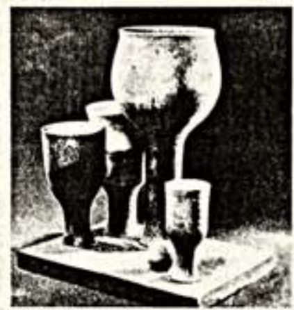
Вазы с шарниром. Демонстрационная композиция.