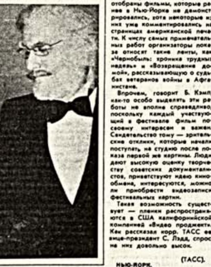
Фото из журнала «Сманья» (Испания).

Время, кажется, не властно над ними. Все так же молоды на лица, так же свежи чувства. Ромку Паур и Аль Бано любят и почитают во всем мире не только как замечательный экстрадидный друг, но и как образцовую супружескую пару, которая недавно отпраздновала двадцатилетие своей совместной жизни. Ее итог — четверо детей (старшей дочери 17, младшей — три с половиной года) и сотни пьес, принесшие популярность, исполнителям и радость слушателям. Не все в их жизни с самого начала складывалось гладко. Мать Ромки, никогда известная актриса, считала, что начинающий певец Аль Бано неподходящая партия для ее дочери и всячески сопротивлялся свадьбе. Она заявила даме, что категорически отказывается присутствовать на брачной церемонии и не даст на нее родительского благословения. Но Ромки была тверда в своем решении. Двадцатилетняя благоосмысленная девушка пошла наперсник матери, и в 1970 году заключены брачные узы. Аль Бано 21 года в черном саване Беатриче в небольшом итальянском город-