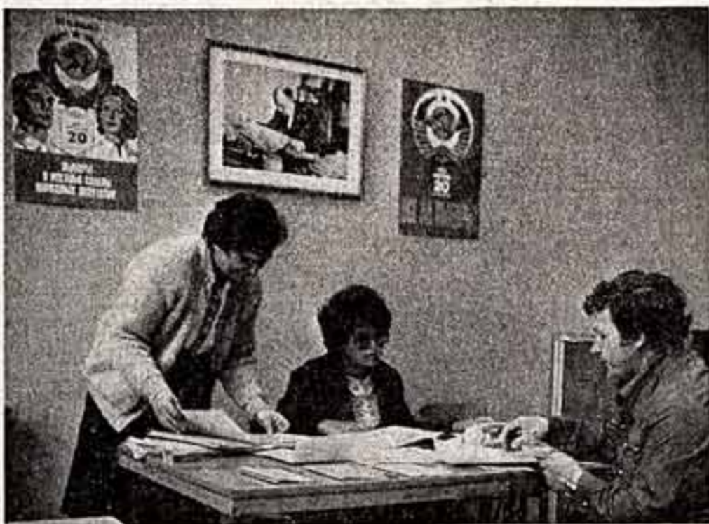
На избирательном участке № 54 Свердловского района столица идет подготовка к выборам.