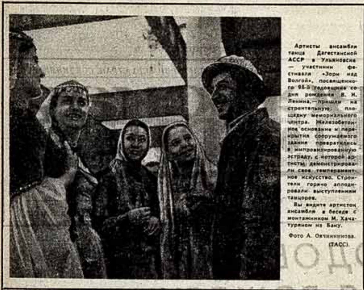
Артисты ансамбля танца Дагестанской АССР в Ульяновске...