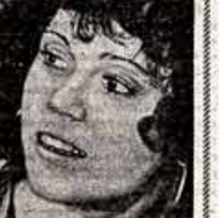
Известная американская киноактриса Дженни Фонда снялась в новом фильме под названием «Стилякские блюзы». На снимке: Дженни Фонда в новом фильме.

М. АБЕЛЕВ, корр. ТАСС — специально для «Советской культуры».