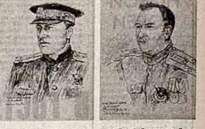
Герой Советского Союза капитан-лейтенант И. Н. Сивакин. Июнь 1943 года.