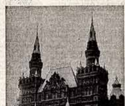
Государственный орден Ленина Исторический музей.