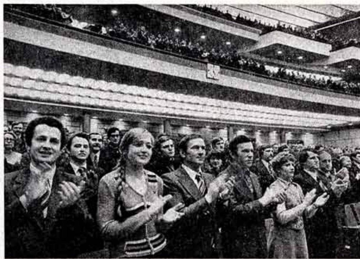
Вчера в Кремлевском Дворце съездов...