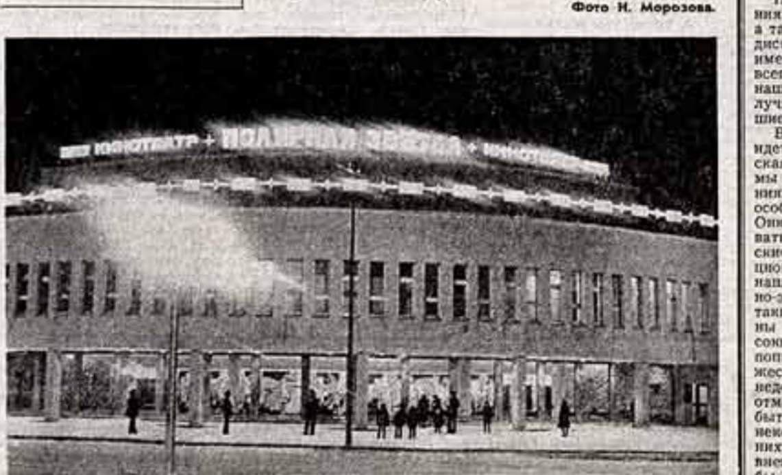
Быстро растет и развивается заполярный город Оленегорск Мурманской области, расположенный вблизи крупного горно-обогатительного комбината. В соответствии с планами избирателей в Оленегорске возведены новые жилые дома, детский сад, Дом культуры, новый кинотеатр «Полярная звезда» и другие объекты. ● Новый кинотеатр «Полярная звезда» в Оленегорске.