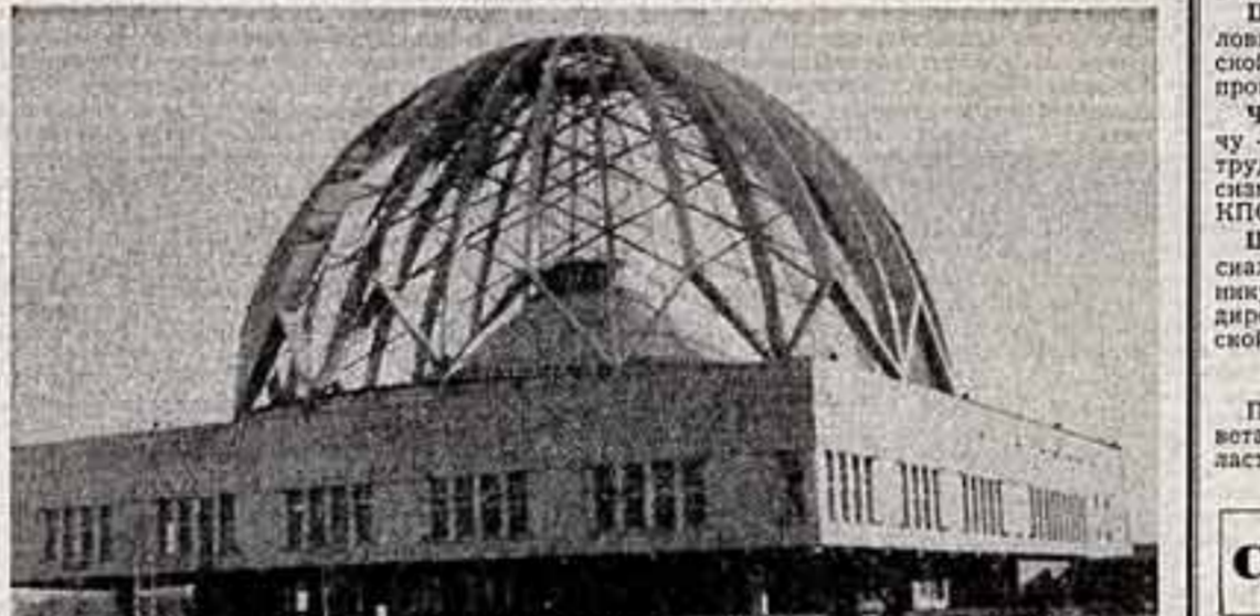
В Свердловске открылся новый цирк на 2.360 мест. Для декоративного оформления интерьера использованы гранит и мрамор в сочетании с причудливыми металлическими лифтами, металлическими конструкциями. В зале диаметром около 60 метров и высотой 27 метров предусмотрены максимальные удобства для зрителей. Здание увенчано большим железобетонным ажурным куполом, который и держит шатер самого цирка. ● Новое здание цирка.