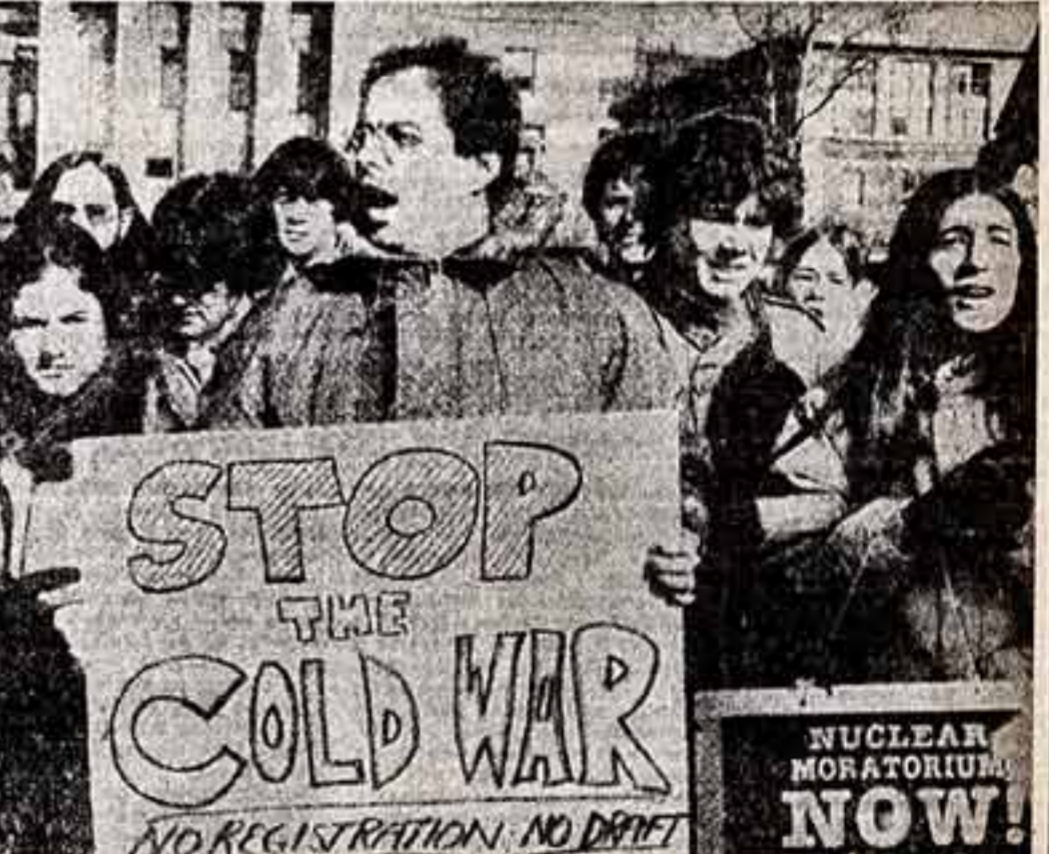
Мощные демонстрации протеста против нагнетания Вашингтоном военной истерии...