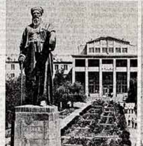
Большой праздник прошел на древней таджикской земле. Трудящиеся республики отметили 60-летие образования Таджикской ССР и Компартии Таджикистана.

Деятельность Всесоюзного театрального общества отмечена ярко выраженной заботой о развитии народного творчества. Видные режиссеры-профессионалы ведут здесь 40 лабораторий, в которых познают свое мастерство около тысячи их коллег из народных театров. Общественные советы при приглашаемых представителях театра на сцене, по театральным представлениям — многое делают для пропаганды лучших произведений советского искусства, поиска новых талантов, организации массовых мероприятий, среди которых ныне важнейшее место занимает героико-патриотическая тематика, посвященная 40-летию Победы.