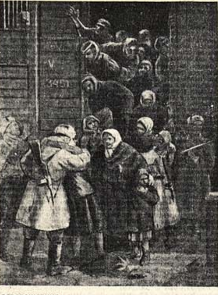
ОСВОБОЖДЕНИЕ. Зина худ. ВОЛОНОВА. Отдана художников пейзажиста ШИД.