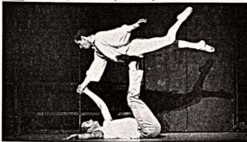
Сцена из спектакля "Дориан Грей".

Спектаклем Мэтью Боурна "Дориан Грей" завершился Международный театральный фестиваль имени Чехова