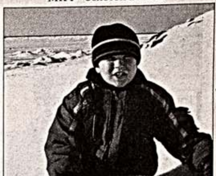
Кадр из фильма "Полночь в Лохе"

В самую теплую пору московского лета — на стыке июля и августа — в стенах Дома кино прошла Международная конференция экологического кино МКФ "Золотой Витязь".