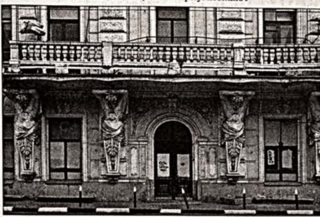
Дом на Солдатке может лишиться статуса памятника