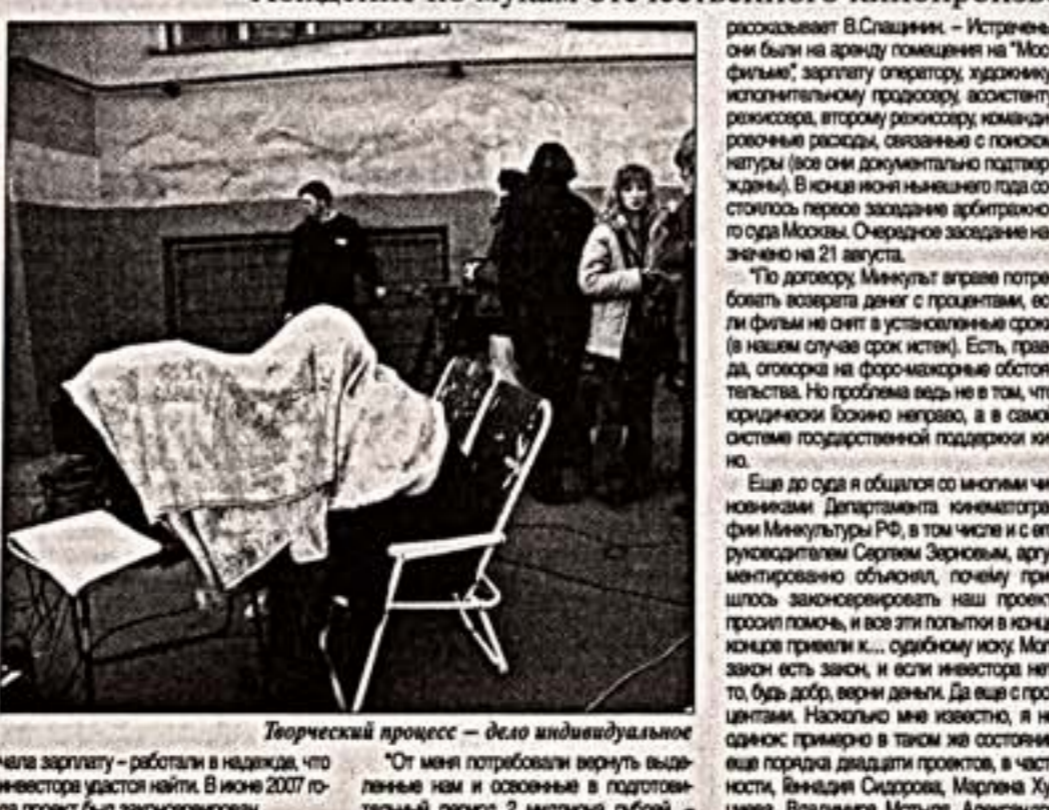
Творческий процесс - дело индивидуальное