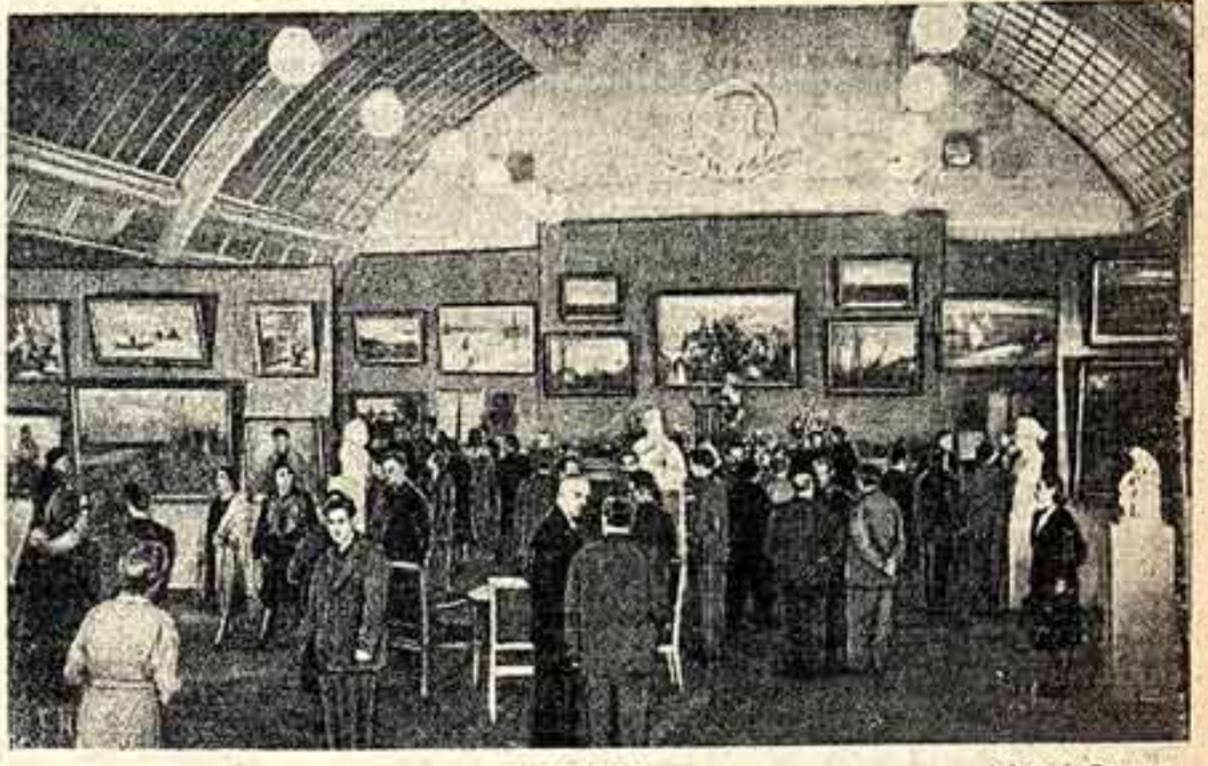
На выставке произведений художников РСФСР 1954 года.