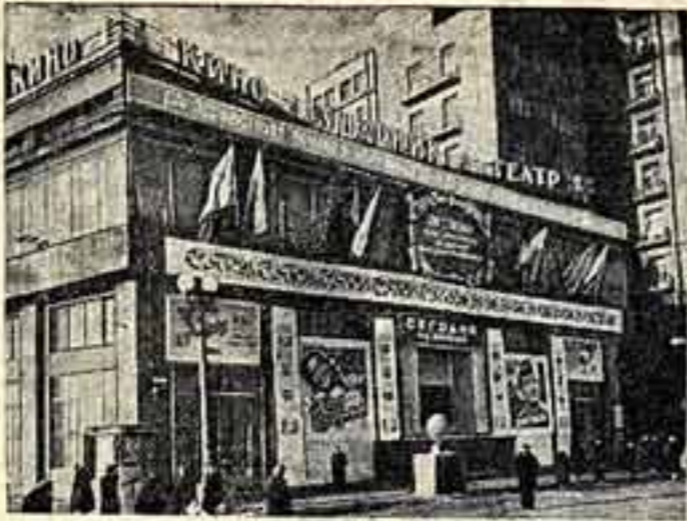
Кинотеатр «Уладинки» в дни фестиваля польских кинофильмов в Москве.