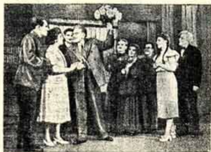
На сцене: сцена из спектакля «Славя В. Гусева...