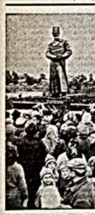
В городе Новозибкове Брянской области открыл памятник герою Октября, председателю Центрального комитета Всероссийского правительства П. В. Дыбенко. Автор — народный художник РСФСР скульптор Ю. Чернов и архитектор Г. Никитин.

Замечательное произведение А. Маньяско будет передано в коллекцию Государственного музея изобразительных искусств им. А. С. Пушкина. (ТАСС).