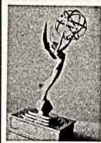
Имя ее — Эмми, она американского происхождения. Премия в ней мало что знала в нашей стране. Потому что «Эмми» — приз Национальной академии телевизионных искусств и наук, который ежегодно присуждается в США за высшие достижения в этих областях. Работники советского телевидения удостоены такой награды впервые.