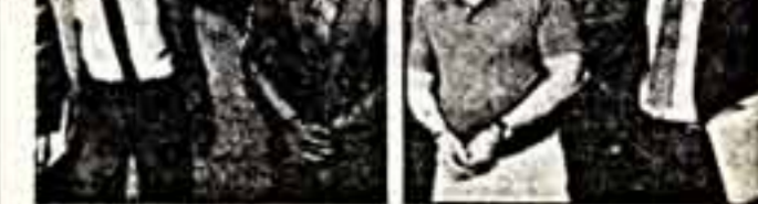
FBI agents arrest officials of Mount Vernon and Yonkers, N.Y.

Недавно два бывших члена городского совета Чикаго и судейский администратор были привлечены к судебной ответственности за получение незаконных платежей от подрядчиков, а в судей на Филадельфии обвинены в получении конвертов с наличными деньгами, призванными повлиять на ход рассмотрения дел. Кроме того, сотрудники полиции Бостона признаны виновными в заговоре с целью продажи полицейского государственного имущества.