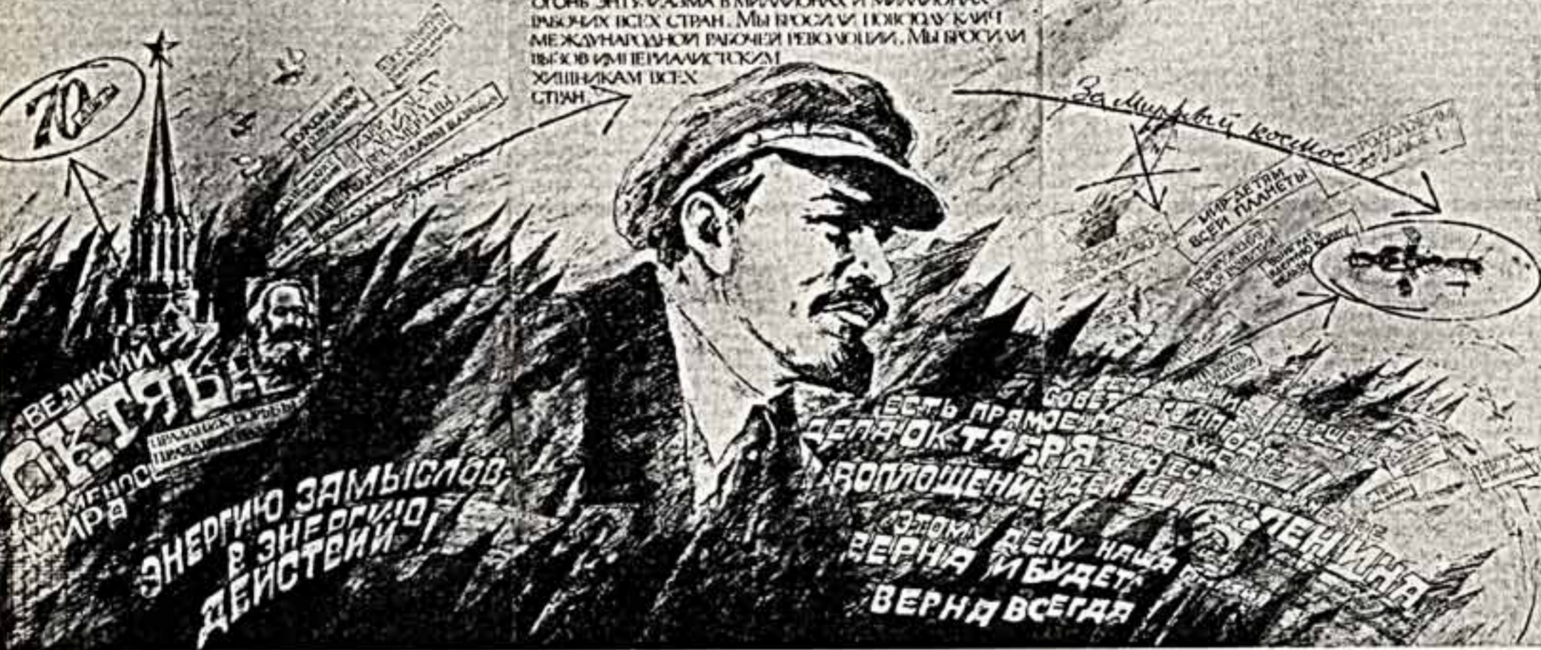
Встречу октябрьским торжествам издательство «Плакат» выпускает рад восторг, посвященных 70-летию Великого Октября.