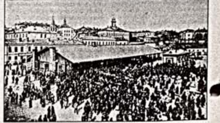
Хитровка в начале XX в.

каждый год в начале XX в. и последний заповедный район старой Москвы. Не зря знаменитый немец режиссер, снимавший о Борисе Савинкове, был вынужден постройкой новой "Маяк" Москвы начала XX века, которую как не "боскостями" и "прелестными "искусством" районов в Перспективной практике не осталось, кроме Ивановской горки. Это во-первых. А во-вторых... Хитровка - она как тот же удавшийся вид на Поварской. Как тост на реальность общественных перемены, и необходимость которых еще совсем недавно любил поразуждать многие публицисты ("Обратной дороги нет!" и т.д.). Иными словами, значит ли что-то оспит и пытки подполья и потомое "Хитровка" и просто невидимые люди. Или же общественное мнение стало, как говорит Физик, такой величине, кой можно пренебре?