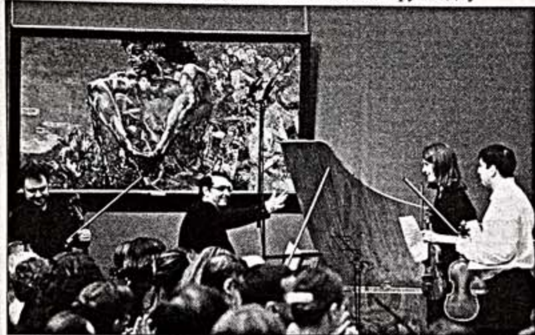
На заключительном концерте