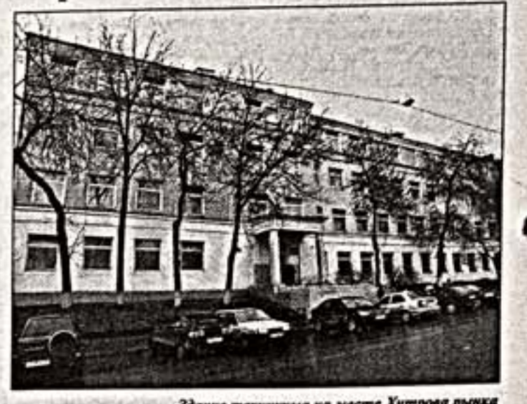
Здание техникума на месте Хитрова рынка

Хитр и позолоченный черной позолотой Хитровой откровенно "бондажили". Хитр и не звучало ни надежды, ни энтузиазма, ни веры в очаживший исторический центр.