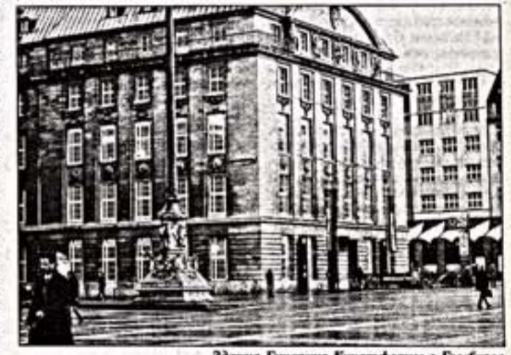
Здание Будучи Кунстфорум в Гамбурге