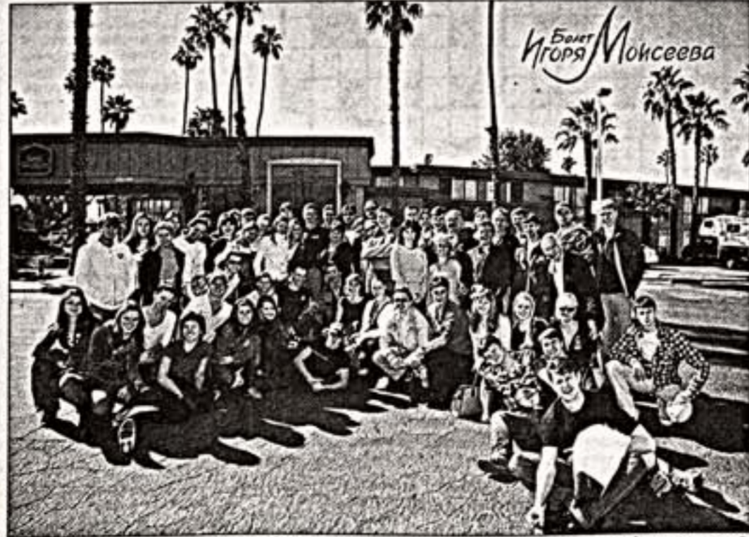
Слева: труппа Ансамбля народного танца имени И. Моисеева в США. Справа: афиша гастроль.

Впервые артисты Государственного академического ансамбля народного танца имени Игоря Моисеева отправляются в турне без своего руководителя, попутная тур памяти Маэстро. Коллектив выехал на гастроли в составе 80 человек с танцами, в разные годы поставленными Игорем Александровичем: это оскот молдавских танцев "Жок", русская "Полочка", заочительная "Апарочка", темпераментный "Бриут" и другие, а завершил концерт оскотный балет на музыку А. Бородина "Половецкие пляски". Премьера состоялась в Вашингтоне. Концерт прошёл с огромным успехом, при полном аншлаге. Зрители долго не отпустили артистов. Всего за два месяца гастрольной коллективе выступили в 32 городах Америки, включая Бостон, Нью-Йорк, Чикаго, Лос-Анджелес, Сан-Франциско, после сорочительного перелёта ансамбль выступил асю Флориду и завершил гастроль в Майами.