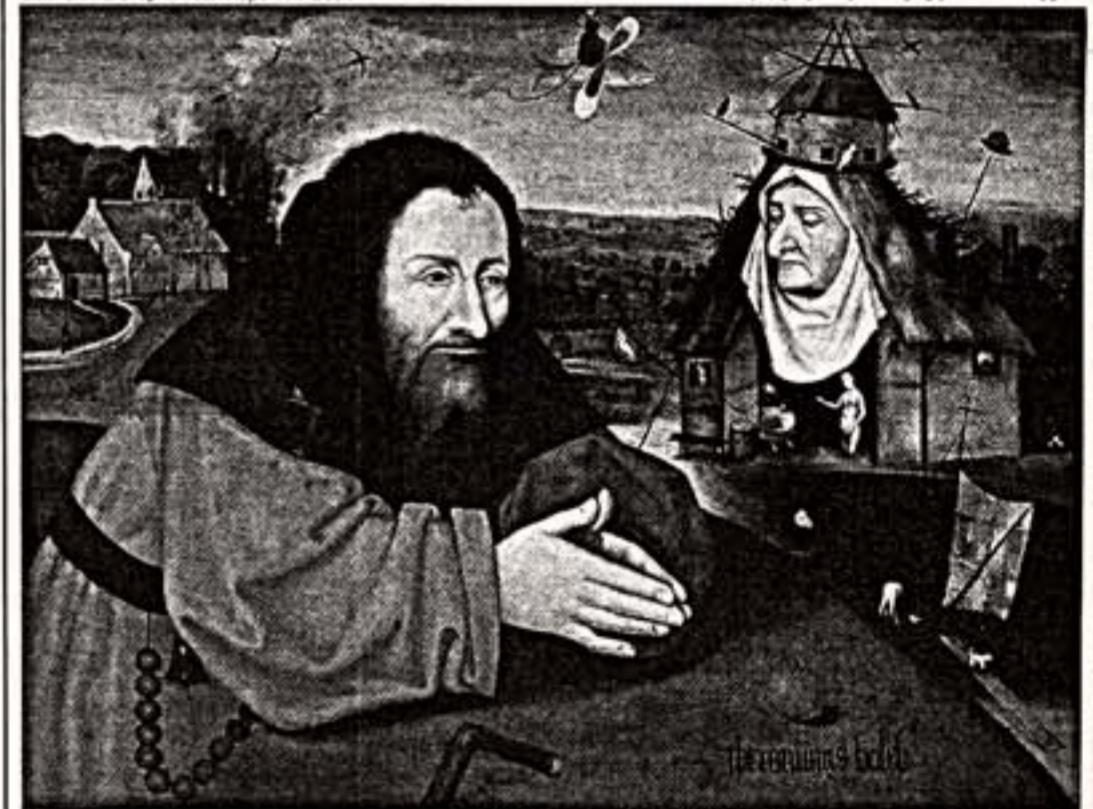
И. Босх. "Искушение святого Антонию". 1525-1530 гг.