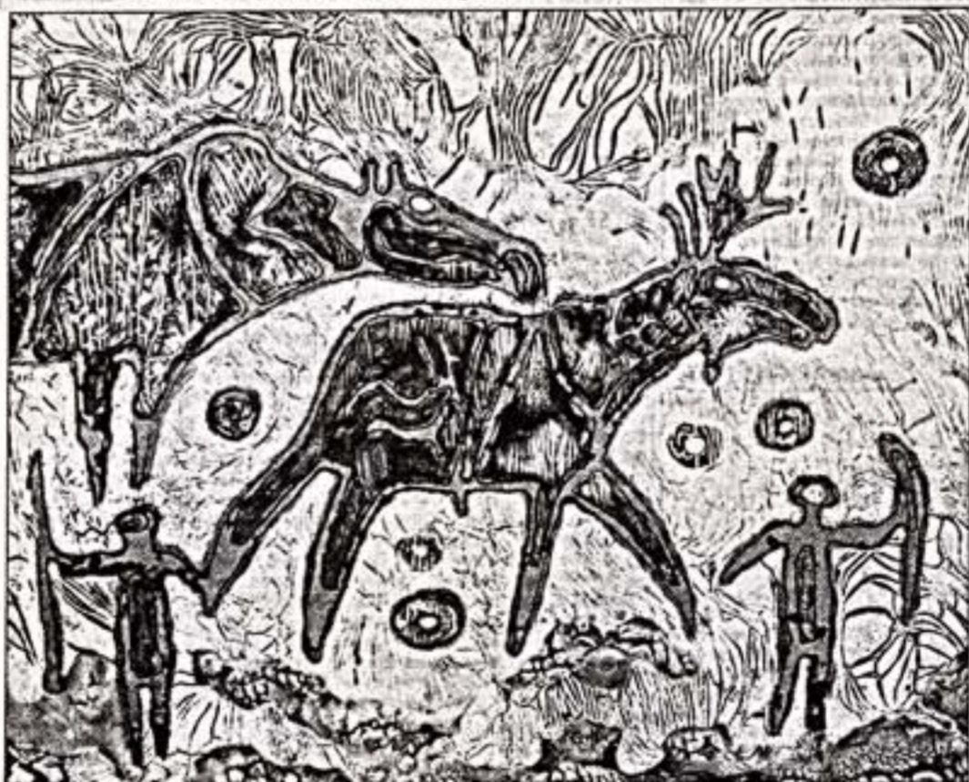
В.Банников. "Охота". 2004 г.

Ханты-Мансийский художественный фестиваль