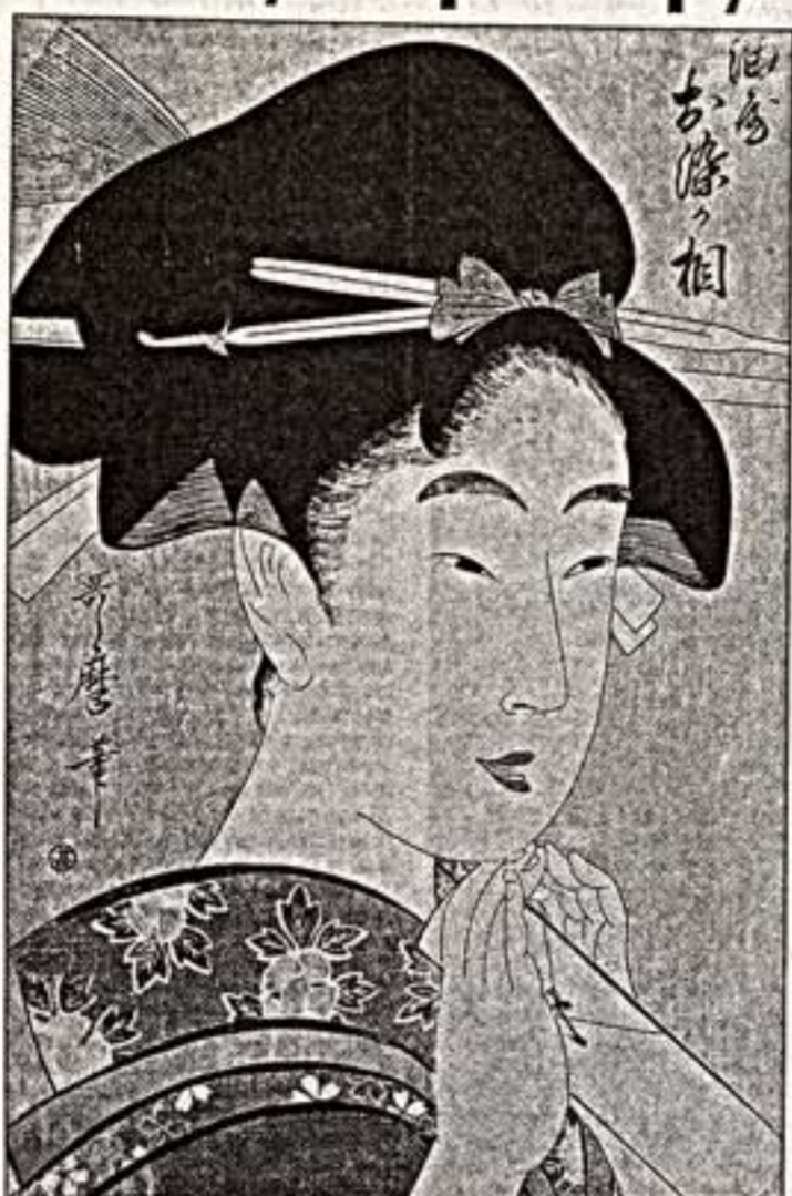
Утамаро. "Осама из Дома Абурая". 1793 — 1799 гг.