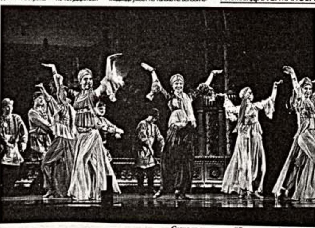
Сцена из спектакля "Великая загадочная Русь"