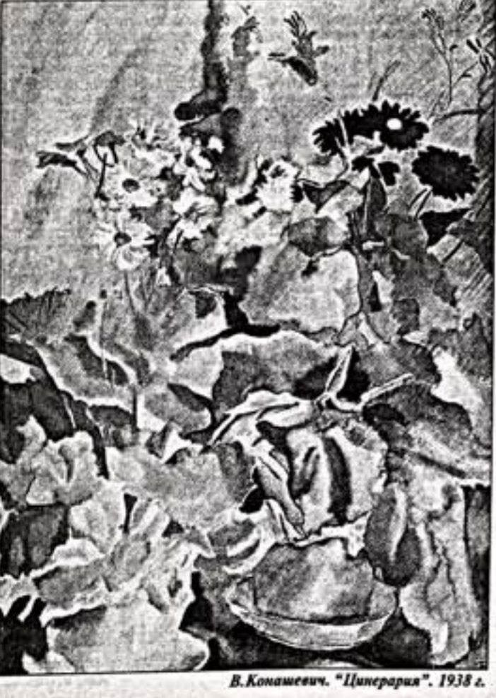
В.Конашевич. "Цитерария". 1938 г.