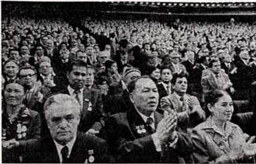
Торжественное заседание в Ташкенте. На трибуне — товарищ Л. И. Брежнев.

В преддверии заседания — кандидат в члены Политбюро ЦК КПСС, первый секретарь ЦК Компартии Узбекистана Ш. Р. Рашидов, Председатель Президиума Верховного Совета Узбекской ССР И. В. Усманходжаев, Председатель Совета Министров республики Н. Д. Худайбердыев, знатные люди труда, военачальники.