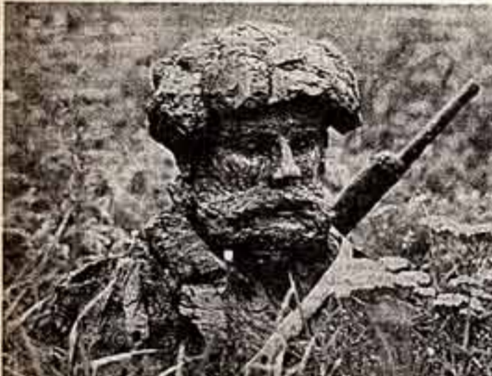
ИЗ ЛЕСА В ЛЕС ПРИШЛИ...