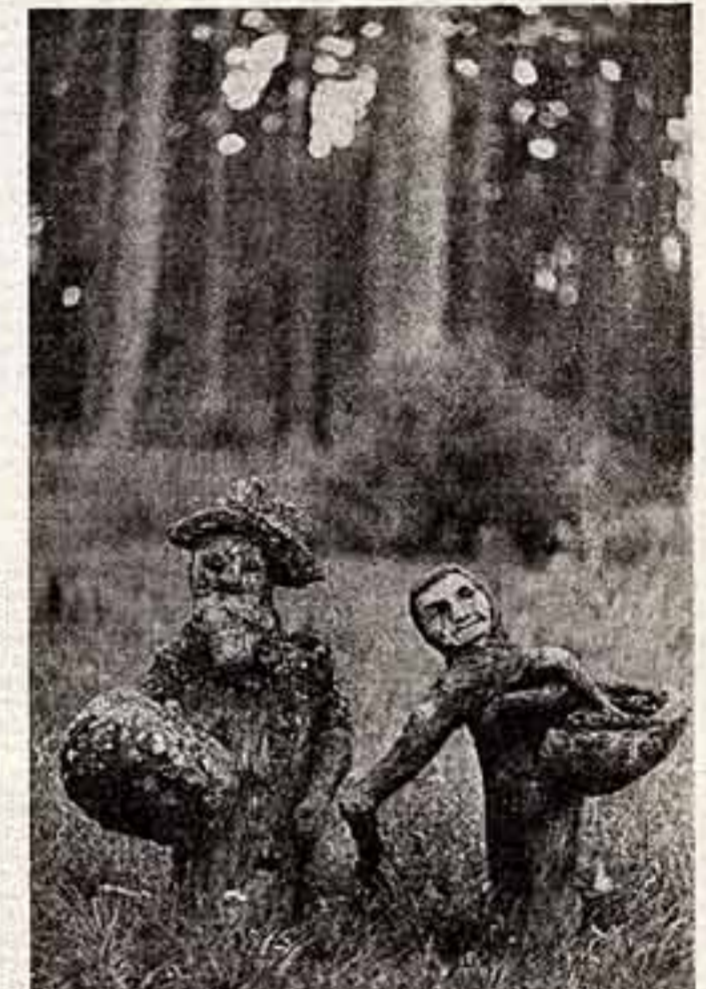
ЗАМЕТКИ РЕЦЕНЗЕНТА НА НЕКОЕМ НЕВЕДОМОМ ОСТРОВЕ...