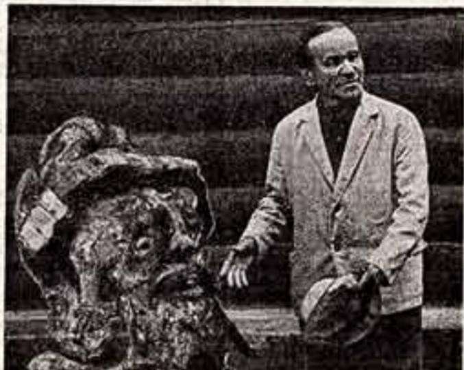
Лебедин участник выставки «Природа и фантазия», обладатель двух дипломов. Сейчас на территории лесничества работает в качестве охотника. В это время работает в лесной охране.