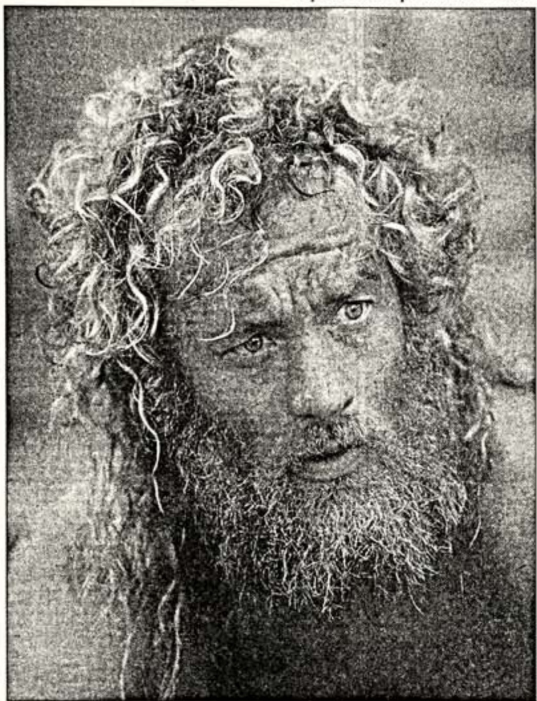
Том Хэнкс в роли современного Робинзона