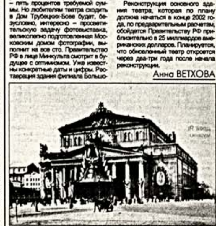
Неизвестный автор. Вид здания Большого театра. Иллюстрация в дни торжества по случаю коронации Николая II, 1896 г.