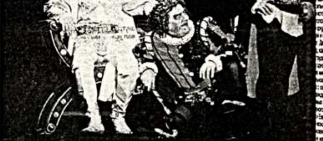
Сцена из спектакля "Риголетто"

Уже только "Граната", где нашлись умопомрачительно с талантом, богатый, донельзя искренним сопрано. Это Татьяна Инга Карна, которую Россия не знает (там ценнее служба ардеанго хурдура оперы Гольдшайн, находящая ардеанго брильянт даже в Германии, где пе-