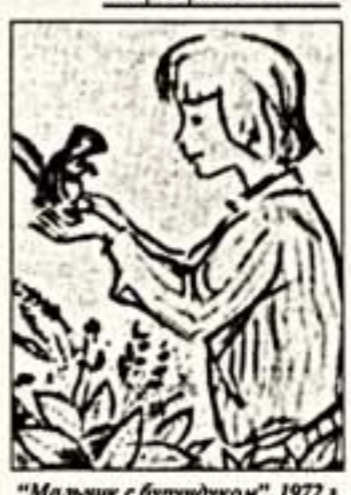
"Малышка с бурундуком". 1972 г.