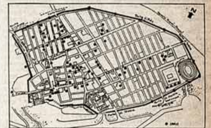
Через несколько дней после землетрясения открыли памятник древней архитектуры в Неаполе...