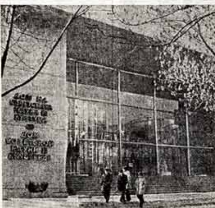
Дом советской науки и культуры в Софии.