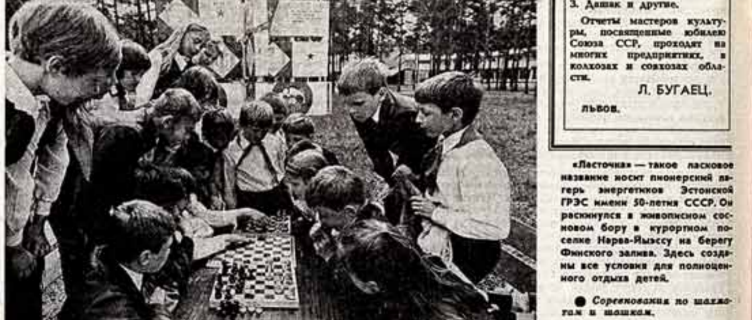
Соревнования по шахматам и шашкам.