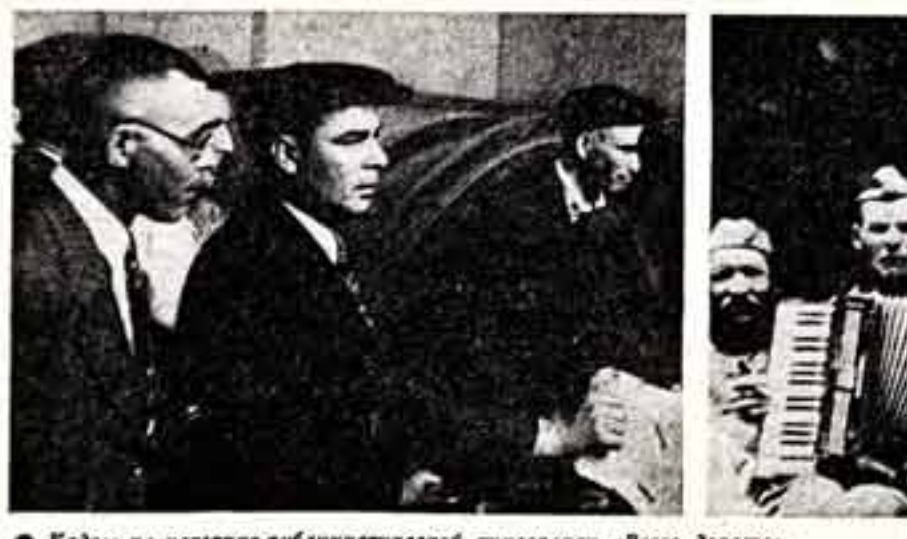
Кадры из историко-публицистической кинооперы «Всего дороже».