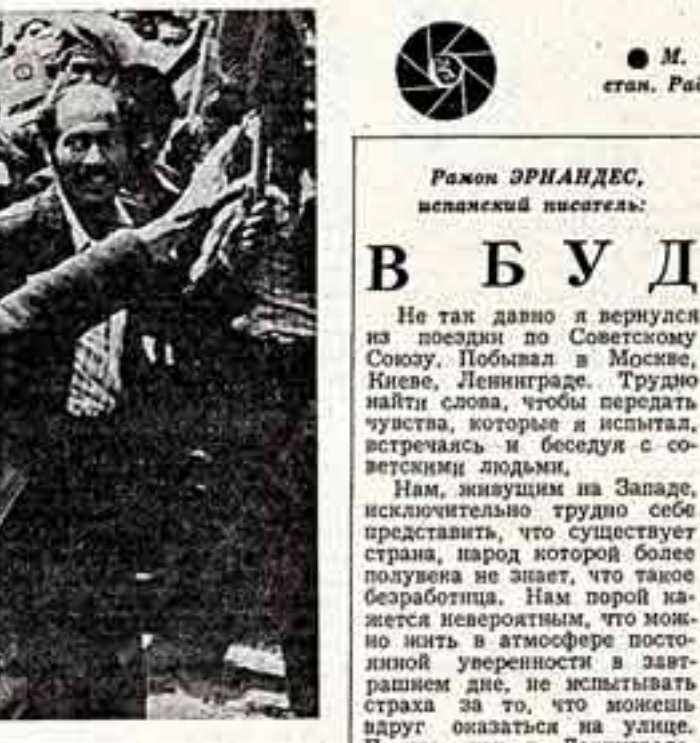
М. ХАРЛАМИНЕВ. «Африкан. Работы победы».