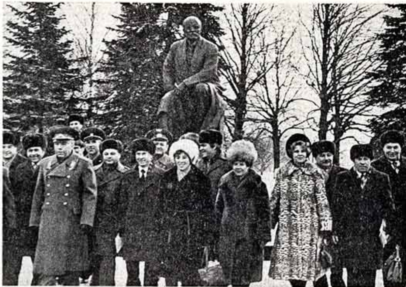
Вчера в Георгиевском зале Большого Кремлевского дворца началась регистрация делегатов XXVI съезда КПСС. Группа делегатов съезда у памятника В. И. Ленину в Кремле.

Творить такое искусство — радость художнику. Радость — работать на коммунизм! Партия зовет к творчеству, к новым горизонтам, к новым просторам. Отклик же творчеством на зов партии!