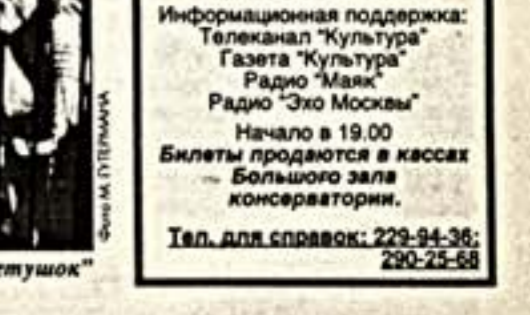
Сцена из спектакля "Золотой петушок"