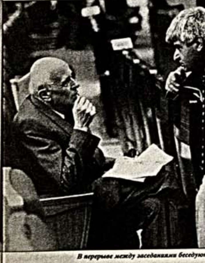
Впервые между заседаниями беседует академик, депутат А. Сахаров и экономист, депутат Г. Попов

Саму формулировку право на смерть многие ученые считают крайне неудачной, поскольку обладателем подобного права автоматически будет иметь право настаивать на исполнении своего желания третьими лицами, что фактически легализует убийство из милосердия. Юристы предлагают вместо этого использовать выражение "право человека умереть достойно". Желание окончить свои дни подобным образом фиксируется каждым из нас, — говорит моя знакомая врач-онколог. — Когда она находится в последней стадии заболевания, речь уже идет не о том, чтобы выжить, а о том, чтобы успеть оказать родным самое главное. Для этого нужно находиться в сознании и не зависеть от жутких болей или наркотических средств. Сегодня существуют, например, недорогие гомеопатические препараты, которые позволяют дожить последние дни без боли. Принимаю их, многие мои пациенты смогли дать необходимые советы своим детям или внукам, написать завещания". За одними безнадёжно больными людьми ухаживают в хосписах специально созданных социальных учреждений, где наряду с врачами работают психологи и психотерапевты, пытающиеся облег-