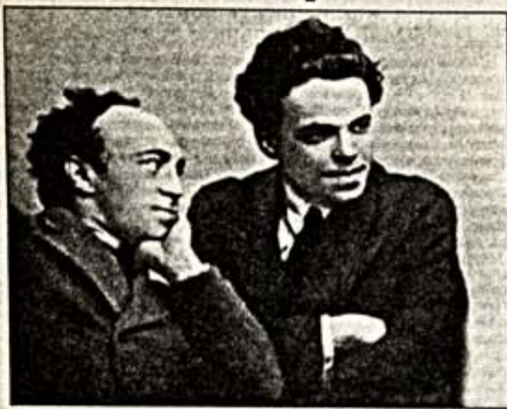
С.Михоэлэ и В.Зускин

В Москве состоялся Второй Международный фестиваль искусств имени Соломона Михоэлса.