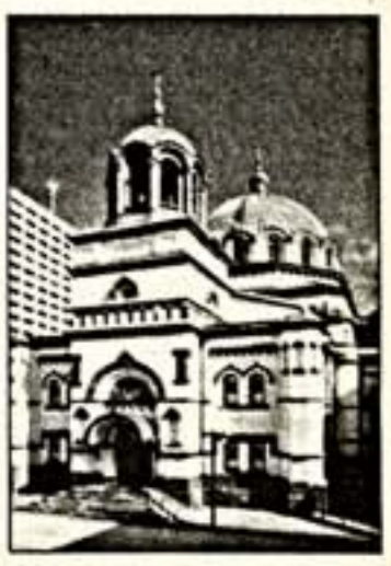
Церковь св. Николая