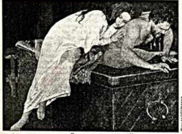
Сцена из спектакля "Царская невеста"