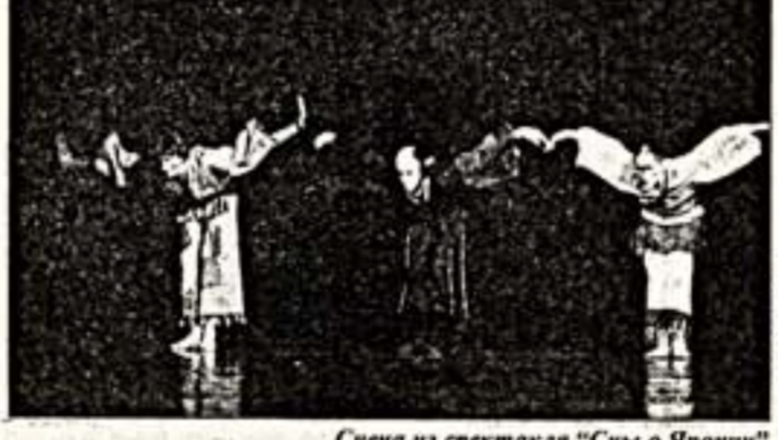
Сцена из спектакля "Сны о Яноши"