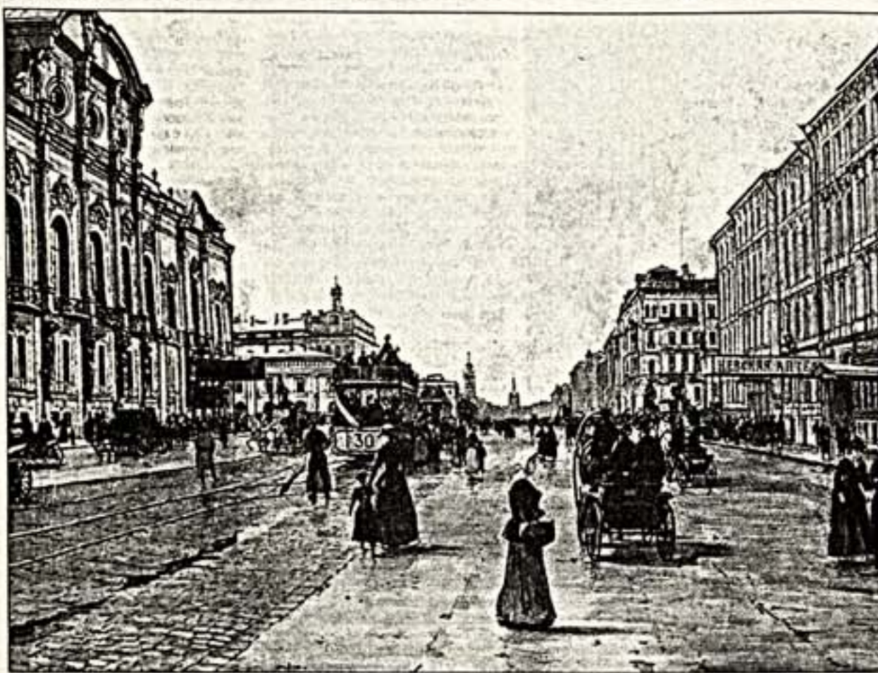
Слева: Е. Лансере. "Невский проспект". 1916 г. Справа: В. Серов. "Обнаженная". 1886 г.

"Пинокотте" вошла в нашу артистическую среду — решительно и серьезно. Первый номер журнала, появившийся почти два года назад, обратил на себя внимание своей высочайшей научностью и ясностью на профессионалов. В обращении к читателям главный редактор Наталья Сидорова обобщила, что история искусства, каталогизация критика — три блока журнала — представляют три классических направления науки об искусстве. В журнале они отделены друг от друга разделами: соответственно "Камера Оскура", "Blow up" и "Калейдоскоп". Поскольку стартовая "Пинокотте" была посвящена академизму, то и читателей встречали статьи, написанные в академическом и неакадемическом манере. Однако дальнейшее развитие подготовило самое интересное, опубликованное в результате проведённого исследования искусства, созданные художниками академического направления, в таком подборе репродукций картин "Академизм в частном собрании" и "Музей на античном рынке". Завершили же номер подробный разбор всех наиболее громких выставок, состоявшихся в мире за 1995—1996 годы, обзор первого антикарикового салона в Москве и торгов "Христи" и "Сотис" и реакции на наиболее интересные искусствоведческие издания последнего времени.