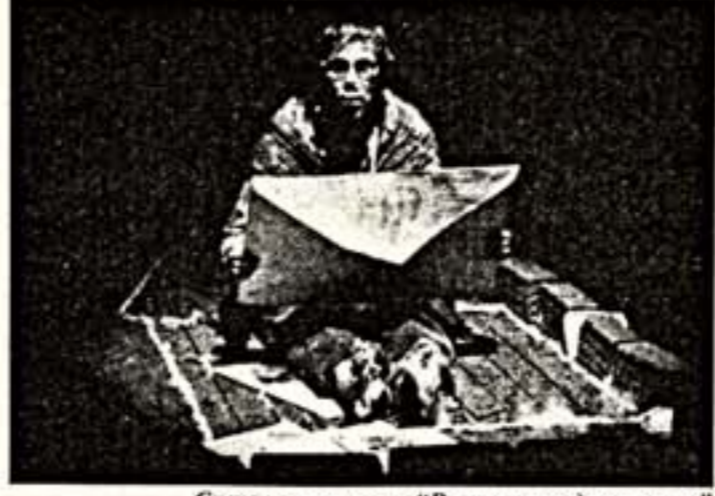
Сцена из спектакля "Русская народная почта"