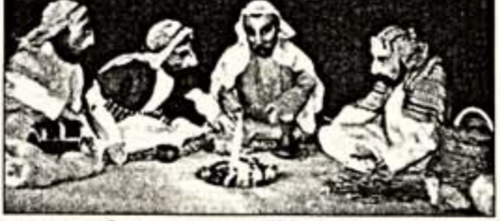
Сцена из спектакля "Huda Iskariot — предатель"