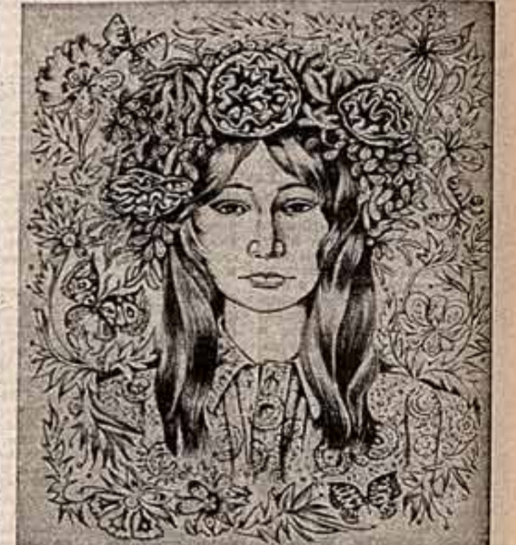
В Аламо-Ате состоялась республиканская выставка графики, на которую было представлено около 800 работ.