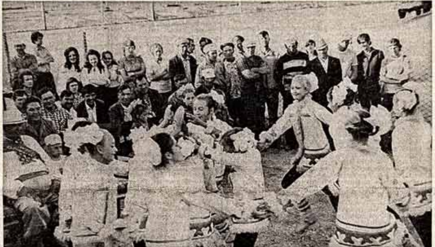
Перед началом жатвы в совхозе «Овощное» Днепровского района Херсонской области состоялся праздник первого снопа. Перед выходом в поле перед механизаторами выступили участники художественной самодеятельности Херсонского дворца культуры и текстильщики. Концерт поочередно сельским