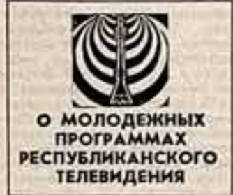
О МОЛОДЕЖНЫХ ПРОГРАММАХ РЕСПУБЛИКАНСКОГО ТЕЛЕВИДЕНИЯ