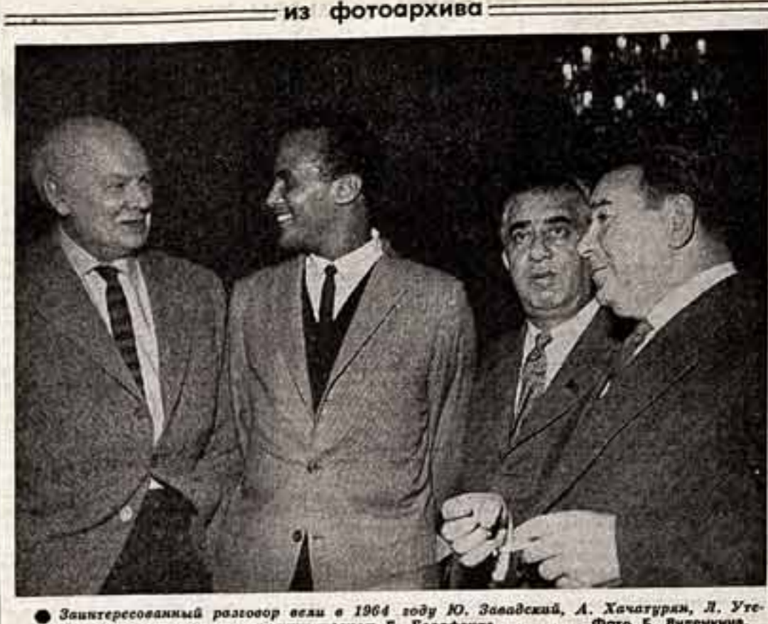
Зантересованный разговор вели в 1964 году Ю. Завидский, А. Качатурян, Л. Утегов с прогрессивным американским летчиком Г. Белфонте.