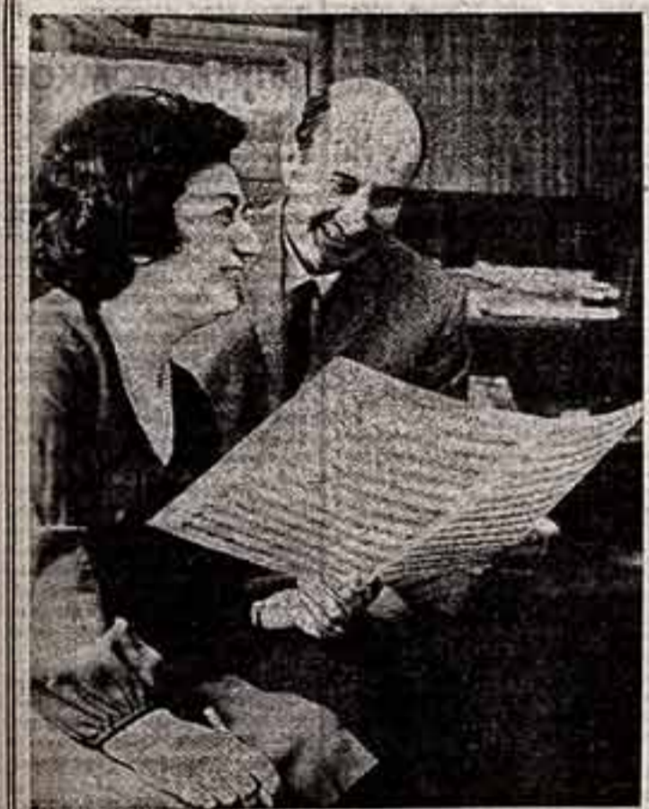
Великая роль женщины-труженицы в Народной Республике Болгария. Она составляет около 47 процентов всех занятых в народном хозяйстве. Женщина — врач и учитель, инженер и научный работник, агроном и музыкант.

Возьмем, к примеру, французский фильм «Великий страх». В нем есть такая сцена: за огромным столом в замке Дракулы идет иррегулярный обед. В замедленном ритме, в цвете, во весь экран появляются на серебряных тарелках человеческие руки, ноги, глаза, языки. Так же медленно и зрелищно появляются руки присутствующих гостей, а затем кладут в рот... Или еще сцена из фильма «Самая длинная ночь дьяво-