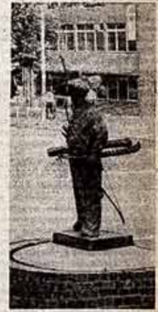
На улицах Токио можно увидеть много интересных памятников.

Ансамбль из небольшого японского города Тамаракудзу популярен не только у себя в стране, но и за рубежом. Интересно то, что все роли в ансамбле, как женские, так и мужские, исполняют только девушки. Ансамбль, в котором сейчас насчитывается 460 актрис, был основан 60 лет назад.