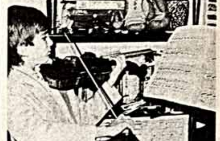
Немного более десяти лет скривил Стефану Малекочку на Болгарии. Но уже сейчас профессионалы называют его великим Николаем Павловичем.