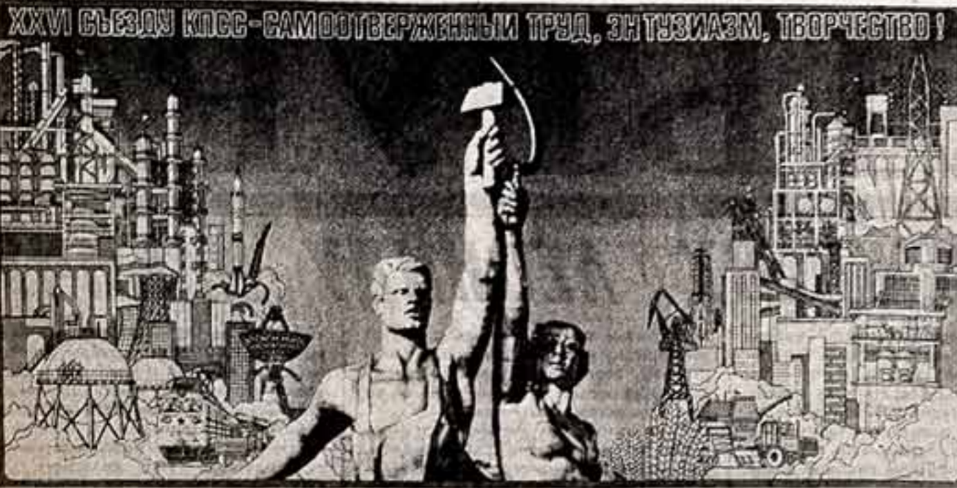
С. МОРОЗОВ. «XXVI съезду КПСС — самоотверженный труд, энтузиазм, творчество!»