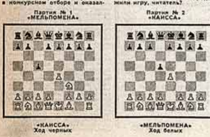
«КАИССА» — Ход черных. «МЕЛЬПОМЕНА» — Ход белых.