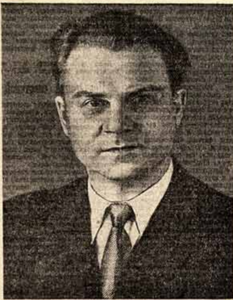
Т. Н. ХРЕННИКОВ

Советская музыка — многогранное искусство. Государственной поддержкой и общественным вниманием выделяется в нашей стране все жанры и виды музыкального искусства.