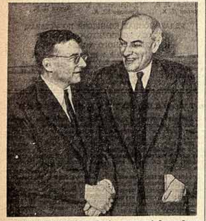
Д. Шостакович (слева) и английский композитор А. Буш на Втором Всесоюзном съезде советских композиторов.