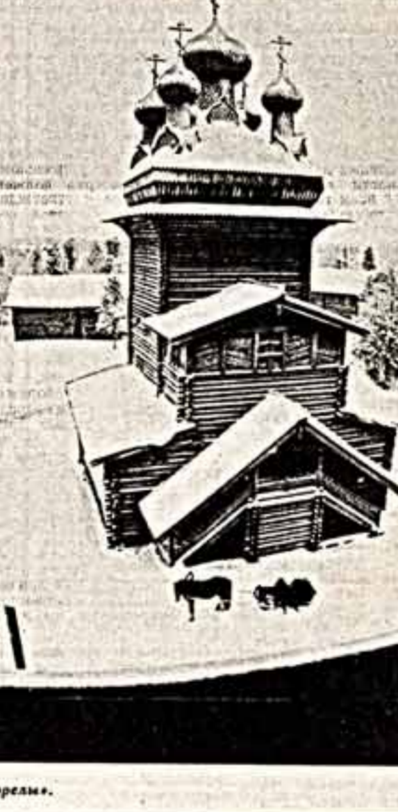
Архангельский музей-заповедник «Малые Корелы».

Архангельский музей-заповедник «Малые Корелы».