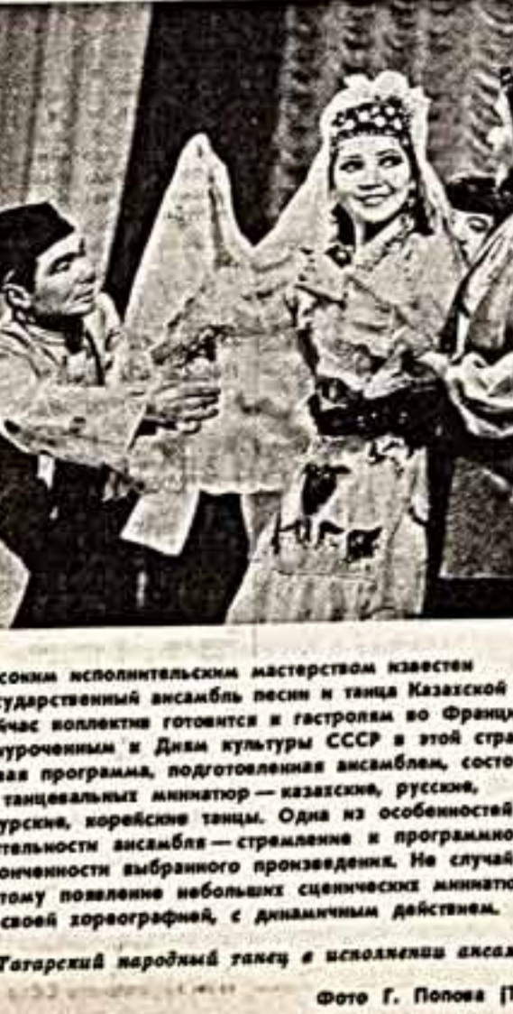
Высоким исполнительским мастерством известен Государственный ансамбль песни и танца Казанской ССР. Сейчас коллектив готовится к гастролям во Францию.