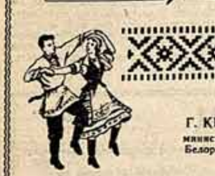
Г. КИСЕЛЕВ, министр культуры Белорусской ССР

40-ю годовщину Великой Октябрьской социалистической революции белорусский народ, как и все братские народы Советского Союза, встречает новыми достижениями в промышленности, сельском хозяйстве, науке и культуре. Стремление к совершенству в искусстве, достижение до сознания народных масс — такова почетная задача всех работников культуры.