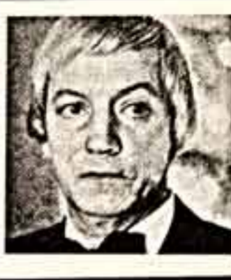
Марис-Рудольф Эдуардович ЛИЕПА