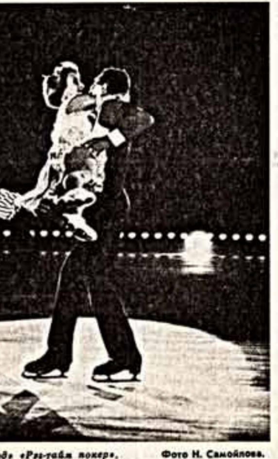
Сцена из спектакля «Все звезды» «Розыба покер».