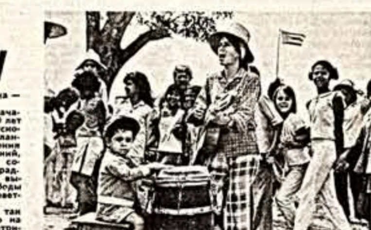
Юные граждане острова свободы учатся дружбе.

Именно в Москве летом 1958 года балетмейстер и танцовщик Рудольф Сабринович «Куба» перенесла Куба.