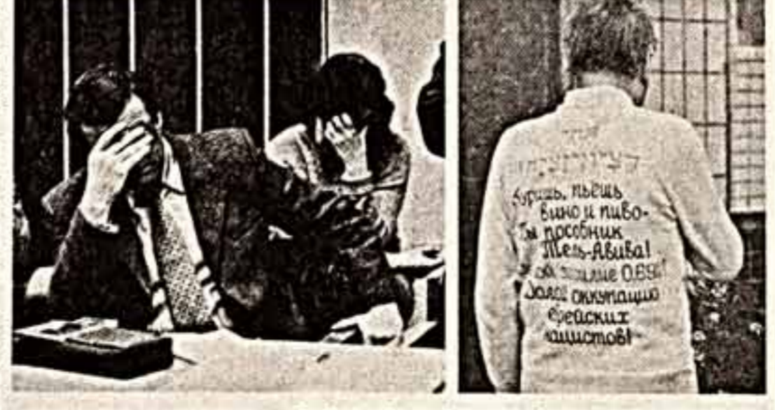
Фотокрифура для своих «досье» всех не согласных с идеями «деснионизации», саж «патриоты» не охотно хотят сниматься. А этот сионист один из присутствующих в зале суда кричал в редакцию сам — с просьбой опубликовать вместе с уставом «Памети». Снимок публикуется, а устав напечатать не позволяет соответствующая статья Конституции... К. КОРНЕШОВ.

Некоторые активисты «Памети» даже носят майки с надписью «Деснионизация общества». Как я понял по выкрикам, эти любители скандалов и митингов в суде хоть сейчас готовы на погромы. Хотя за рестриктивную пропаганду существует уголовная ответственность. Да и наша газета 18 февраля с. г. писала в статье «Здесь искать не стану...», что в Москве залы судебных заседаний превращаются в трибуны для несанкционированных митингов «Памети», о том, что власти не принимают мер