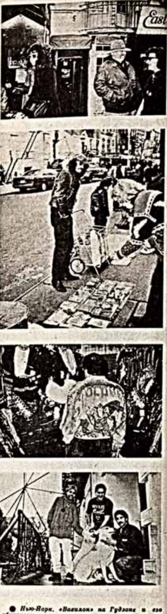
Нью-Йорк. «Валялок» на Гудзоне и его обитатели.