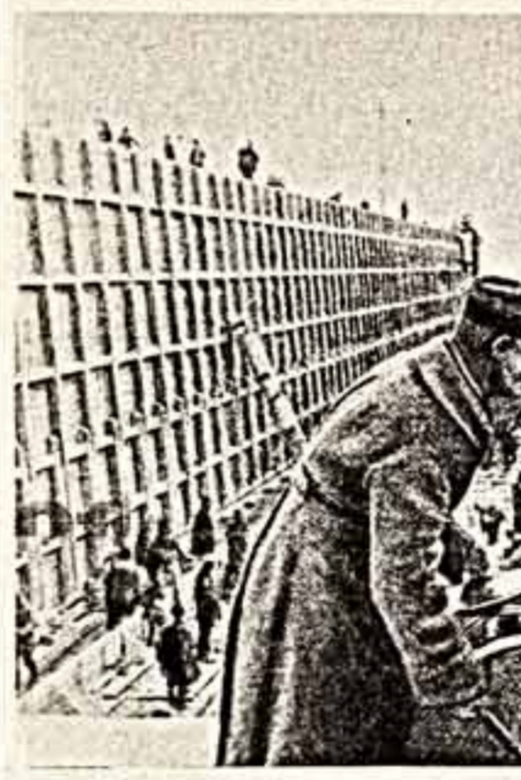
Уже высту шлюзятся пароходы, а здесь, у шлюзных ворот, еще играет оркестр.