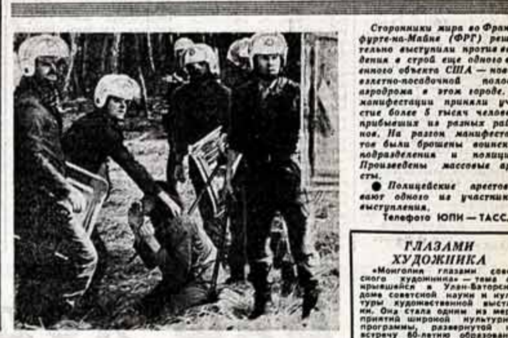
Старинники мира во Фрагфурге-на-Майне (ФРГ)...