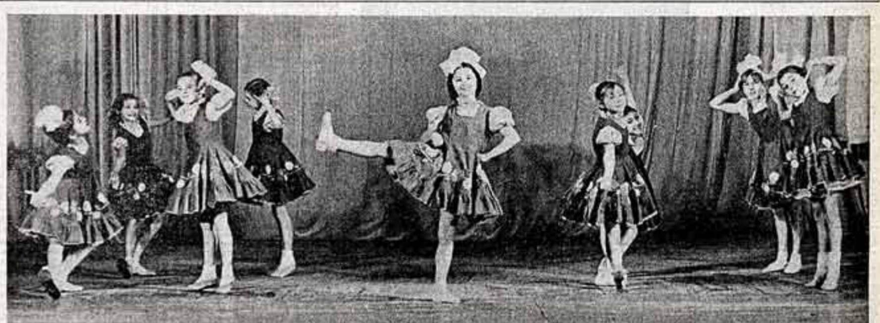
● Большой популярностью в Хакасии пользуется детский хорозграфический ансамбль «Саяночка» областного Дома культуры. Здесь показывается стучной танец «Веселые говорюшки».