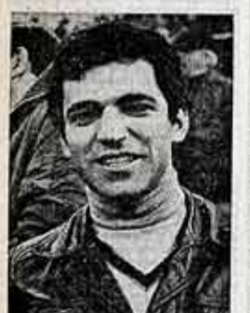
Очень шахматный мир станет свидетелем интереснейшего поединка двух советских гроссмейстеров высшего класса — Анатолия Карпова и Гарри Каспарова. А пока соперники готовятся к решающей схватке.

Сегодня наш собеседник — знаменитый гроссмейстер из Баку Гарри КАСПАРОВ.