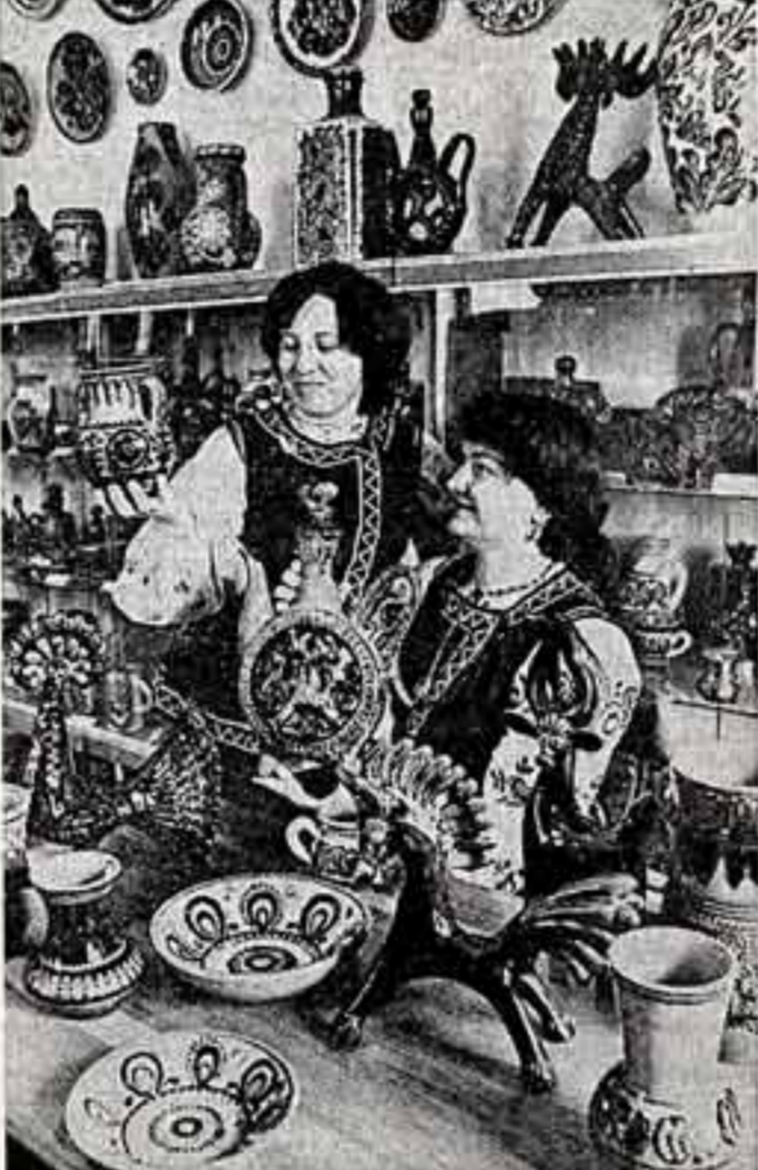
Сочиня, богатым украинским орнаментом славятся изделия Васильковского шелкопрялового завода, что на Украине. Художники и мастера предприятий, создавая новые образы посуды, сувениров, скульптур, бережно хранят народные традиции. Предприятие производит более шестидесяти видов изделий, в том числе шестидесять из них — novità.

Это постоянная забота Академии художеств СССР, которая видит свою задачу в том, чтобы хранить и приумножать лучшие традиции отечественной художественной культуры. В свое время академик — весь процесс развития советского изобразительного искусства, каждой его национальной школы, проблемы эстетического совершенствования облика советских городов и сел, предметной среды, окружающей человека, капитальные научные исследования в области истории и теории искусства, вопросы глубины и боевостности художественной критики, размаха и эффективности пропаганды искусства, воспитание творческой молодежи и эстетическое воспитание подрастающего поколения. Все это в конечном счете работа по воплощению в жизнь ленинских принципов партийности и народности искусства, тех принципов, которые лежат в основе всего нашего культурного строительства. Эта работа по духовному развитию нашего общества.