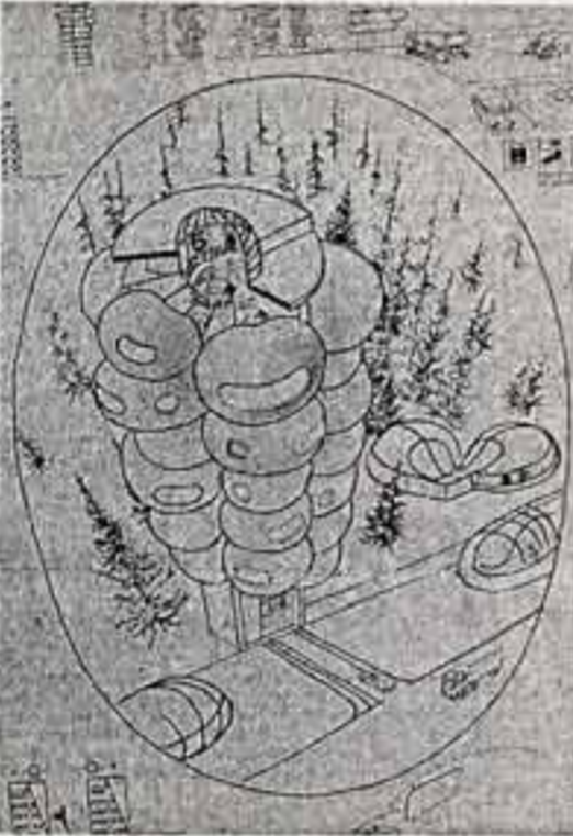
Проекты, представленные на конкурс ЮНЕСКО «Жилище будущего»: ● Дом «вчерашних чокочеников», ● Город-парк, ● «Карманный» дом.