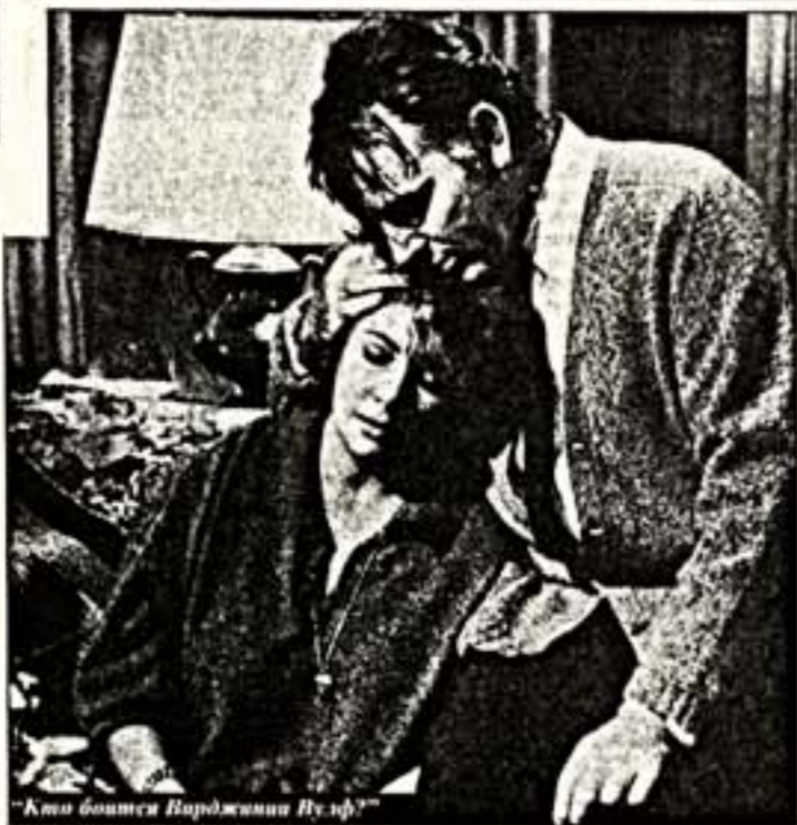
Аль Бано и Ромина Пауэр

да — помню, мы ели спагетти с соусом и котлетки. Мама подлила голову от тарелки: "Куда ты пойдешь?" — спросила она. Я был сражен. Эти три слова, ее взгляд стоили целого трактата по метафизике! С моими сестрами у меня тогда были самые хорошие отношения. В общем, мои женихи я всегда обожал, но жил своей жизнью! — И еще говорят: Альберто не любил раздавать обещания, женился, но никогда не выпендился! — Признаюсь, было такое. Влюбился, как мальчишка. Знаете, как это бывает: тебя приводит в дом, она смотрит с нежностью, плечу дружелюбно хлопает по плечу... Устоять нет сил — и ты уже помолвлен. Однако в последний момент я, как правило, начинал сомневаться, вспоминал... В общем, что не могу быть верным одной женщине, что не хочу, чтобы вторгались в мой внутренний мир... и ретировался. Однажды после целого года напряженной работы — я снял за двенадцать месяцев одиннадцать фильмов — решил отдохнуть и уехал в Альпы, поселился в удивенной горной гостинице. Познакомился там с очаровательной дочкой хозяина, влюбился — дальше все было, как уже сказал: столь милая моему сердцу домашняя обстановочка, хорошая женщина, влюбленная девушка, добродушный папаша... В общем, сделал предложение. Уезжая в Рим, договорился, что они