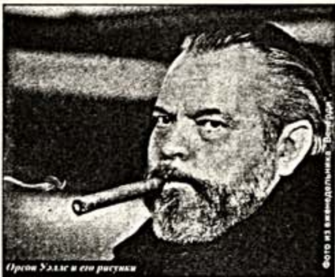
Орсон Уэллс и его рисунки