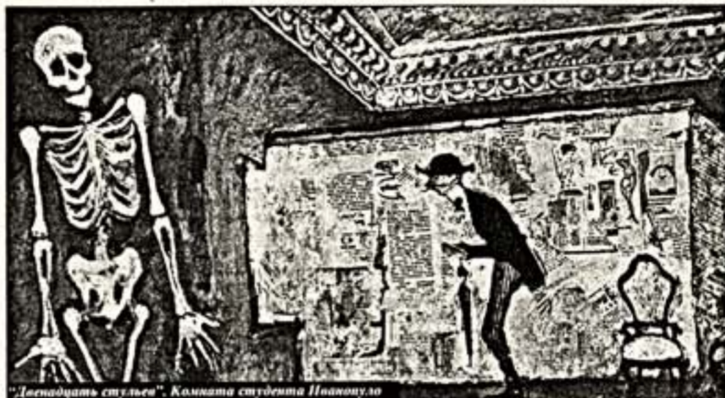
"Двадцать стульев". Комната студента Иванкову

Хочу закончить тем, с чего начал. Пенальти, что этот большой кусок жизни позади. Но и радостно сознание от то-