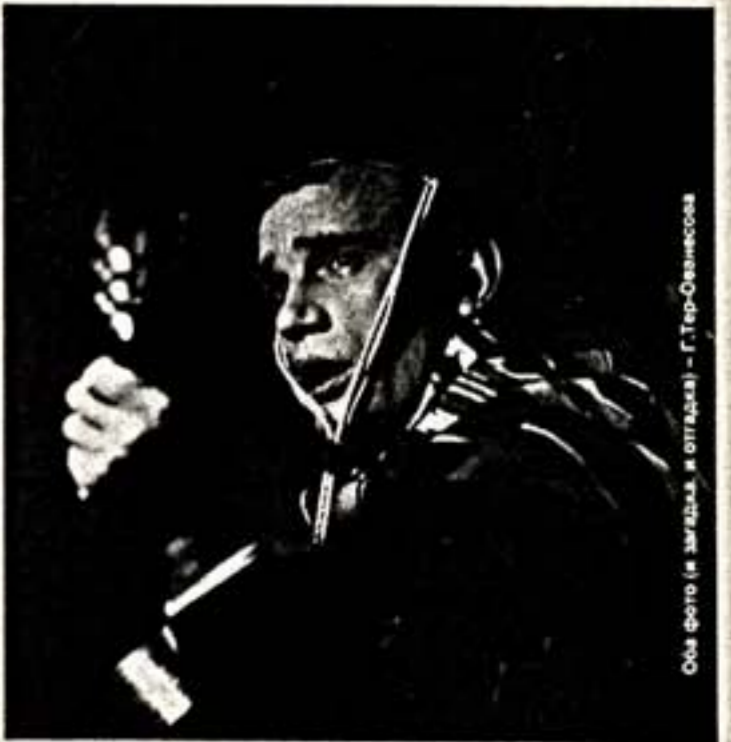
См. фото (с левым и правым)