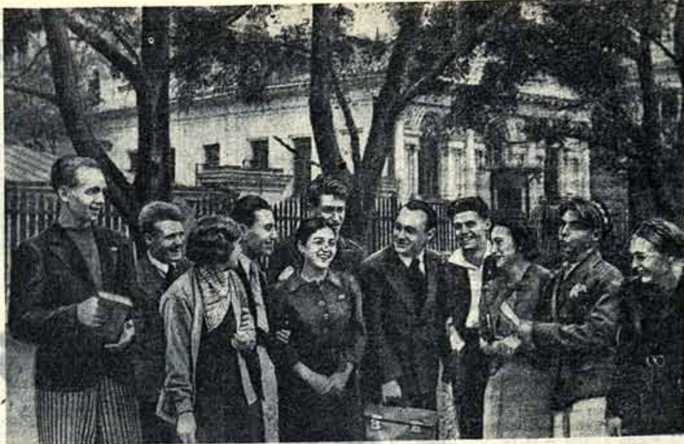
1 сентября в Гитисе начался учебный год. На снимке: студенты Гитиса перед началом занятий