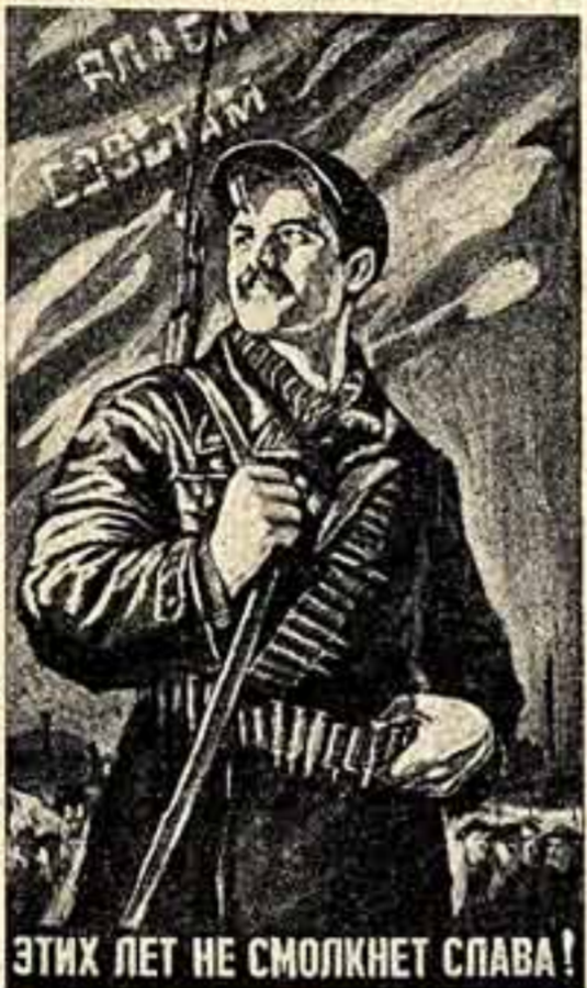
ЭТИХ ЛЕТ НЕ СМОКНЕТ СЛАВА!

Планет художника В. Тишина, выпущенный Издательством «Детская литература» в ознаменование 39-й годовщины Великой Октябрьской социалистической революции.