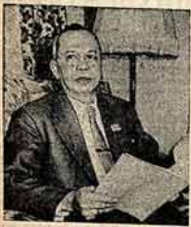
Министр просвещения и культуры Бирмы У Тун Тим.