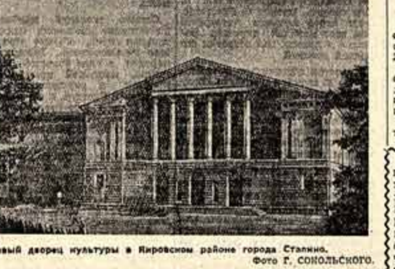
Новый дворец культуры в Кировском районе города Сталинно.

против этих тенденций была крайне слабой. Они не только не встречали энергичного противодействия, но, напротив, утвердились в результате той вредной практики, которую долгое время проводила бывшее руководство Оргкомитета Союза художников и руководство Академии художеств, наследовавшие методы грубого администрирования, важными критериями, группировки, зачисления всех индустриальных, не угодных ни художникам и критикам в разряд «врагов реализма», бросая обвинения в формализме даже целым коллективам. Так было сделано, например, в отношении такой крупной организации, как Московский союз зрелищных художников.