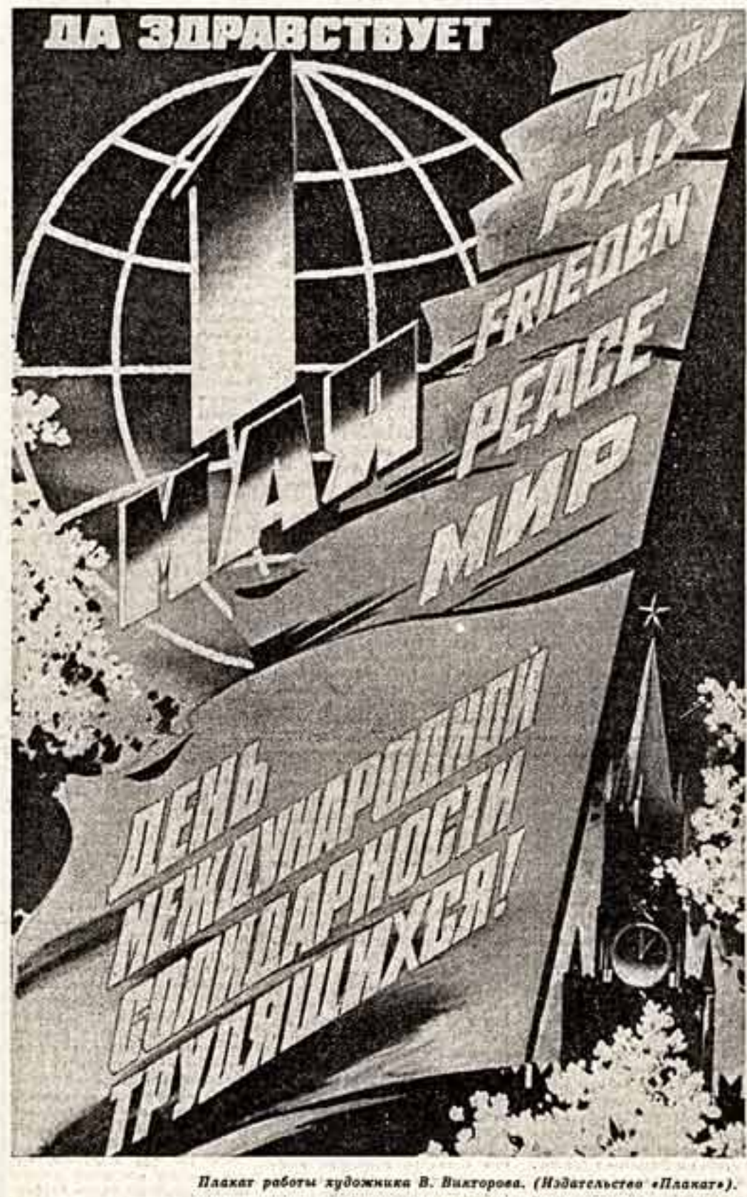
Плакат работы художника В. Викторов. (Издательство «Плакат»).

При капитализме чистый свет науки не может сиять иначе как на темном фоне невежества, говорил Маркс. Социализм разорвал эту невежество и неграмотность, огнем знания озарил самые дальние уголки