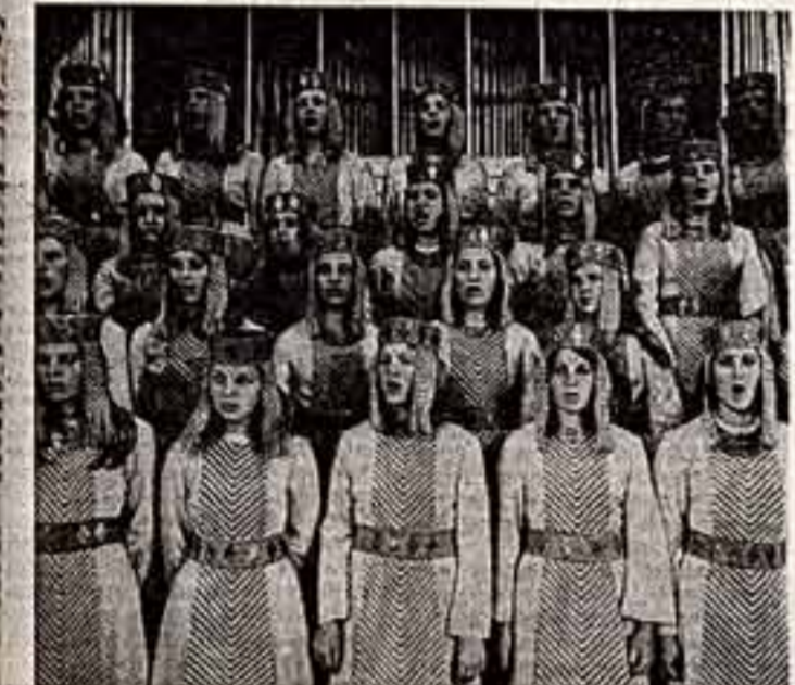
Каждый будущий работник культуры должен обязательно уметь петь. Хор Вильямского училища отмечает на его лауреат республиканского конкурса.