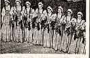
Шесть лет работает самодельная коллекция при Дворце культуры жемчужина хлацобукажного комбината «Трегорская мануфактура».