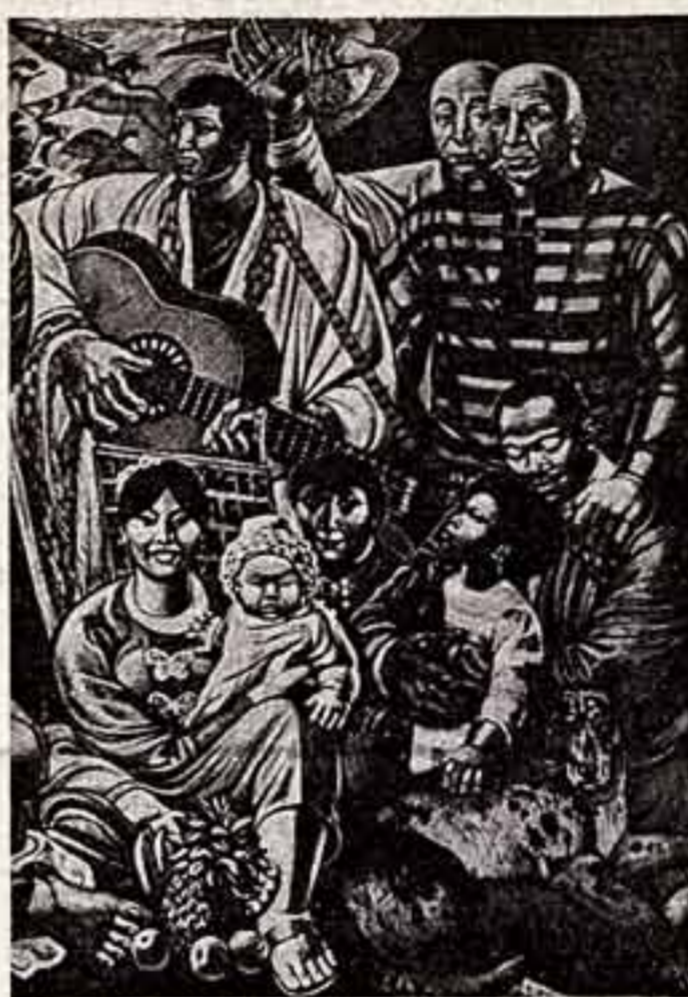
Фрагмент картины «Люди будут жить, как братья». Благодаря Сусанне Кант-Хорн за ее искусство. З. ГОРФИНКЕЛЬ, РМГА, художник.