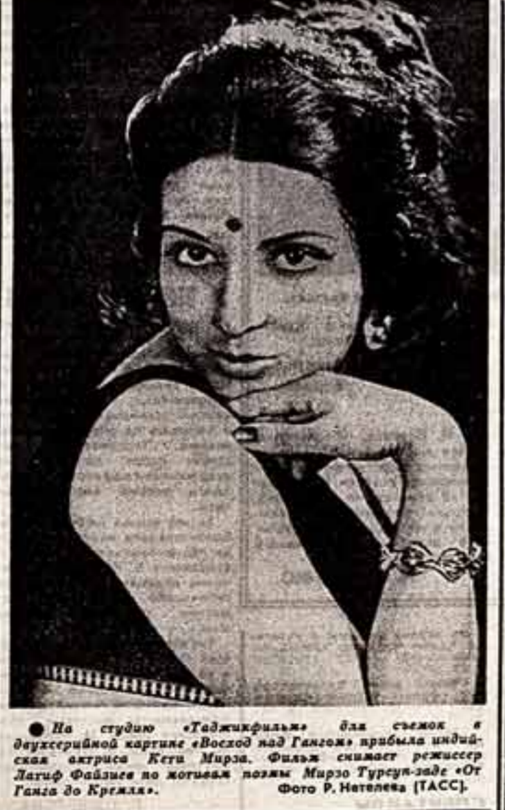
На студию «Таджикфильм» для съемок в двухсерийной картине «Восход над Галгом» прибыла индийская актриса Кети Мирза. Фильм снимает режиссер Лагид Файсал по поэмам поэта Мирзо Турсунзаде «От Галга до Крмала».

— С большим интересом был прослушан доклад международной комиссии СССР Ю. Борисовой «Об условиях труда и правах женщин в театральном зрелищном предпринимательстве СССР».