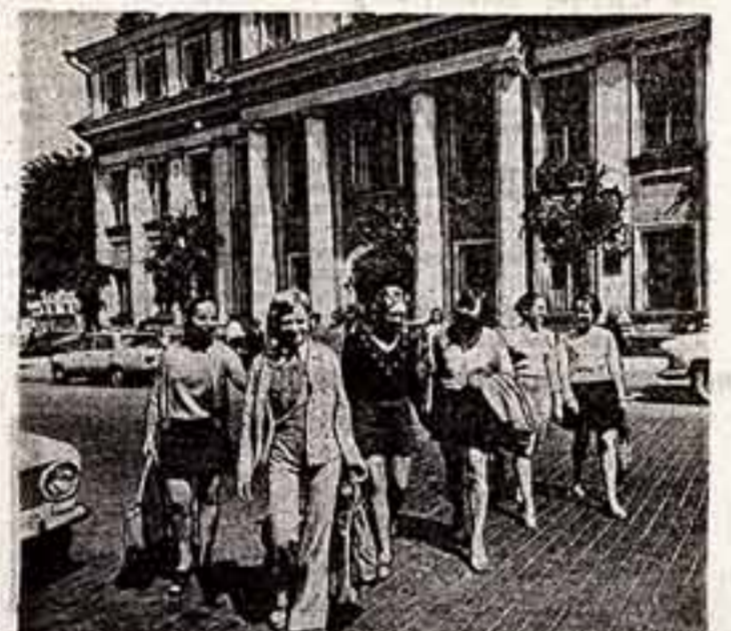
Эти музыканты Вильямского училища культуры скоро разъедутся по разным районам Литовской ССР.

У ТИЛЬНАЯ автобус, надсаженная большое медвежья кутур, одолевая километры. А я ехал во Дворец культуры в деревню Кресноуфимского района про охват местного населения мероприятиями и думал: «Сейчас меня тоже охватят. Хорошо, если лекции или концертом. Хуже, если докладом». Воображение рисовало кадры местных докладчиков и легкомысленных артистов.