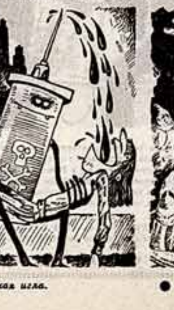
П. КОЛИН. Рисунок И. Смирнова.

Список проблем, против которых клан ведет яростную борьбу, весьма велик. Ему неизвестны контроль за национальным оружием, министр лиц, дезертировавших или уклонившихся от призыва во время войны во Вьетнаме, модернизированные школьные учебники, борьба с наркоманией, разрядка напряженности.