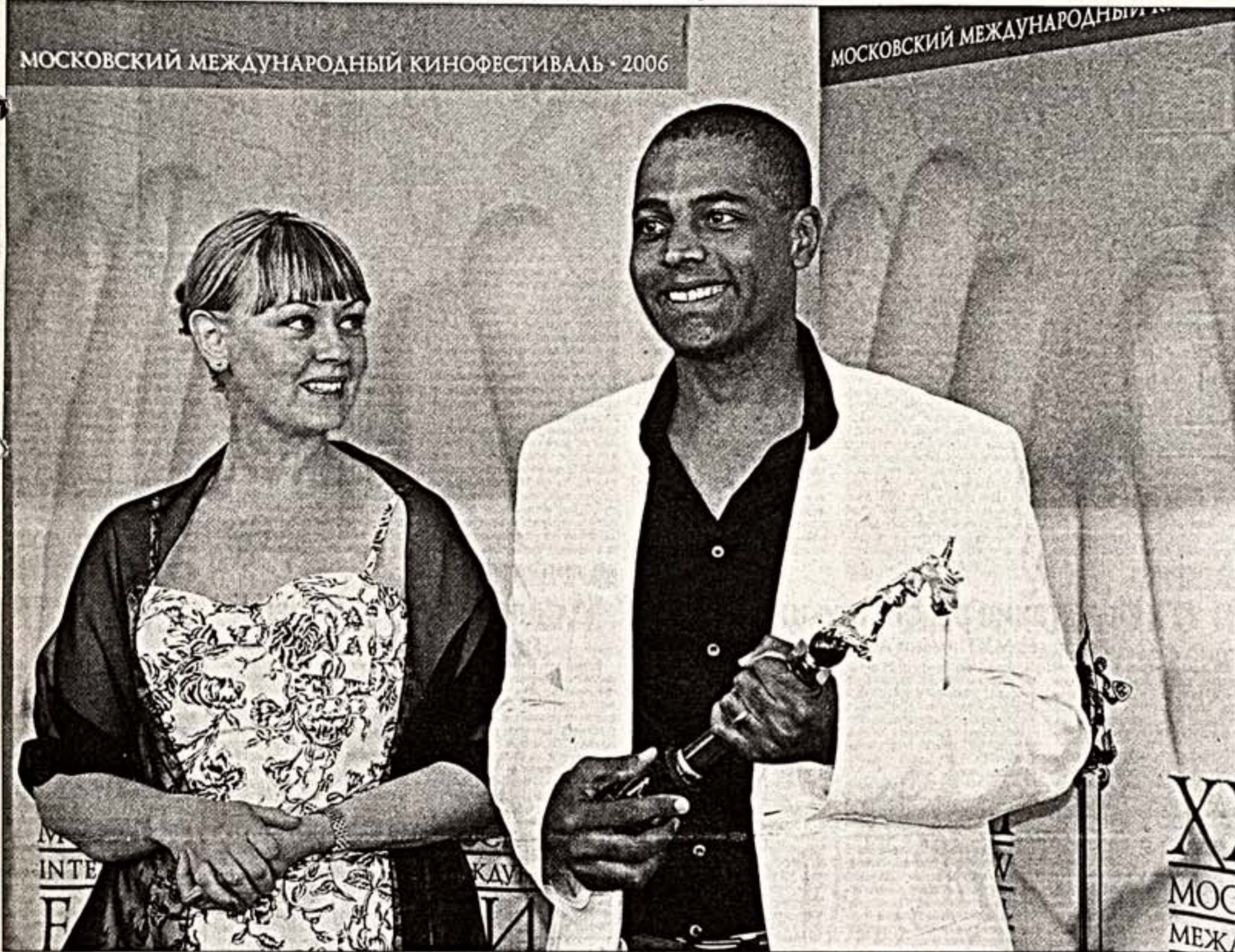
МОСКОВСКИЙ МЕЖДУНАРОДНЫЙ КИНОФЕСТИВАЛЬ 2006

Итоги XXVIII Московского Международного кинофестиваля: ничего невозможного нет