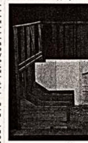
Макет к спектаклю "Наполеон и Корсиканка"

В "Подрастании" Давид придумал лабиринт разрывов - около ста - бытовых ширм того времени, скрепленных по дугам на одной устойчивой оси.