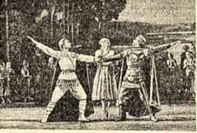
Сцена из балета «Лайма».

Музыка А. Лепиня, построенная на латышских национальных мелодиях, приятна