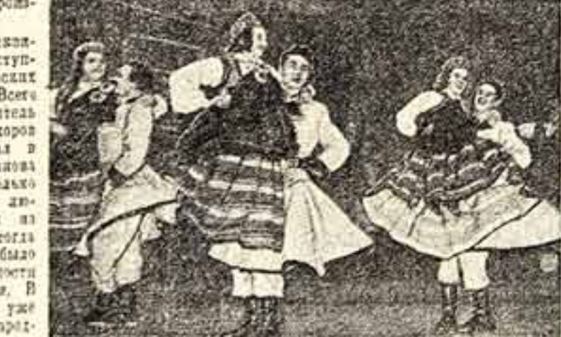
На снимке: выступление художественной самодеятельности колхозов «Земля дружна» и «Сарнаис Октотрис».