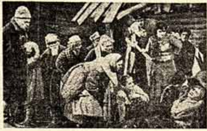
Сцена из спектакля «На дне».