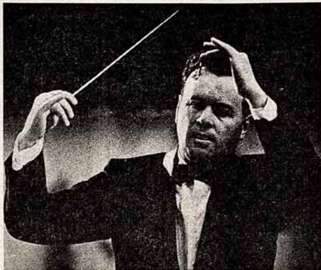
Народный артист СССР Е. Светланов.