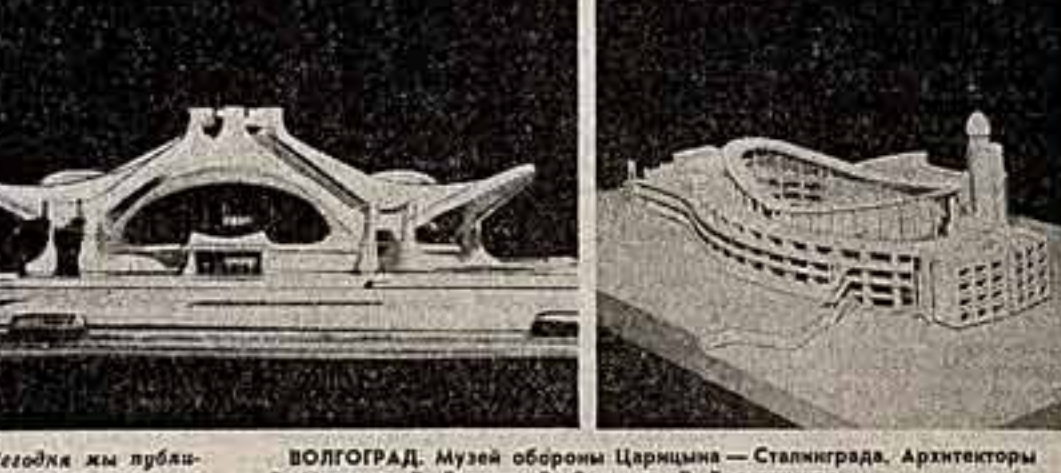
Мир, который будет окружать нас завтра, — так можно назвать то, что сегодня рождается на чертежной доске архитектора. Это аэропорты и жилые кварталы, латвийки в театры, школы и промышленные комплексы. В проектах мастеров начинается жизнь зда-