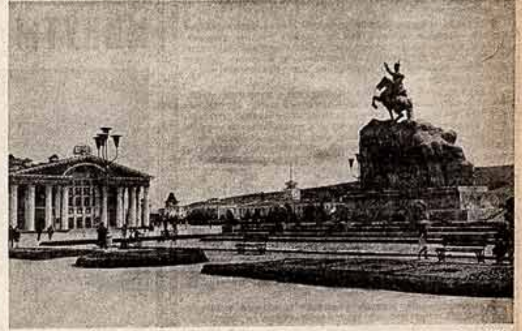
Город Улан-Батор. Площадь Суз-Батора.