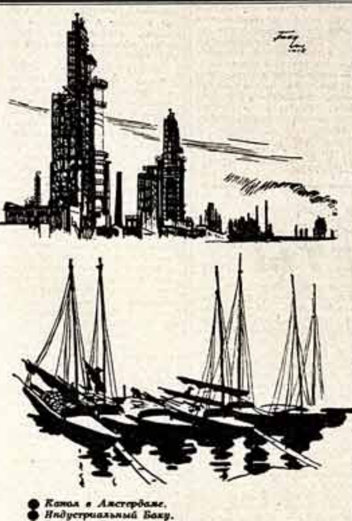
Канал в Амстердаме. Индустриальный Ваку. Вьетнам. Дюссель.