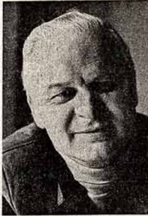
С. РОСТОКХИН, народный артист СССР, автор сценария и режиссер, — за художественный фильм «А зори здесь тихие...».