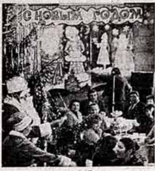
● В просторной фойе Дома культуры создано «Головокружение» Наро-Фоминского района Московской области идет предновогодний «Огонек» для жителей районов.

На митинге присутствовали член Политбюро ЦК КПСС, первый секретарь МК КПСС В. В. Гришин, председатель ВЦСПС А. И. Шибанов. (ТАСС)