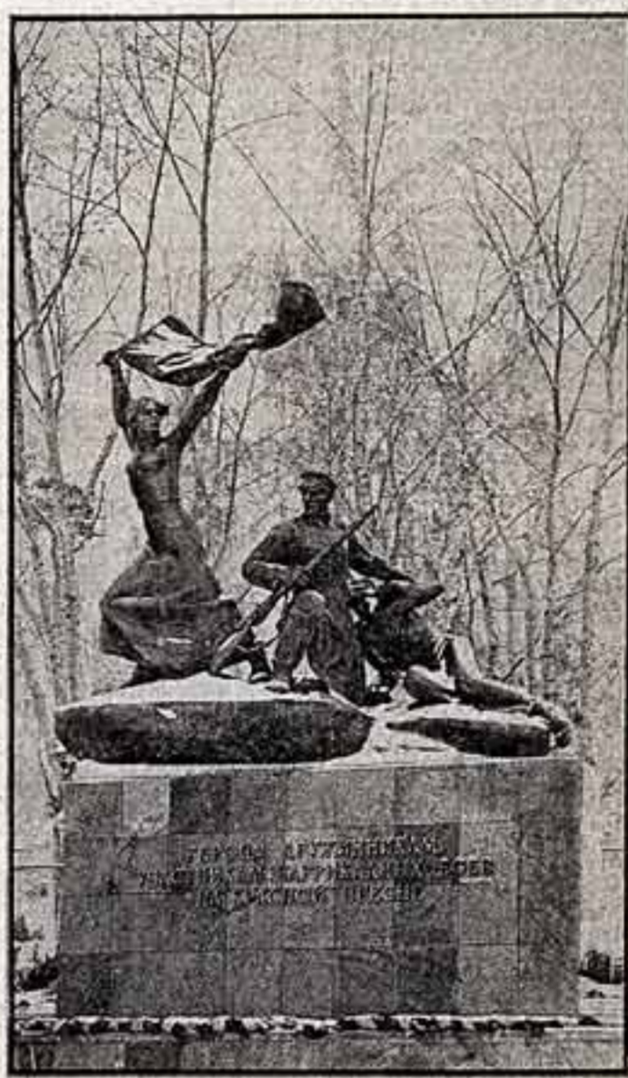
● Монумент героям-дружинникам, участникам баррикадных боев на Красной Пресне.