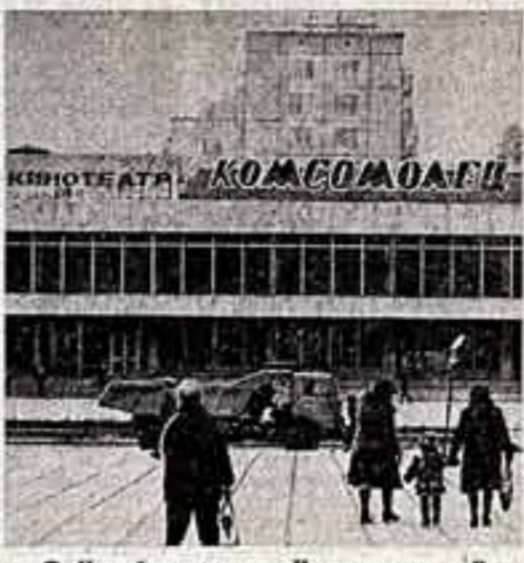
● Новый кинотеатр «Комсомолец» в Вологодском. Два его зрительных зала рассчитаны на 1.100 мест.