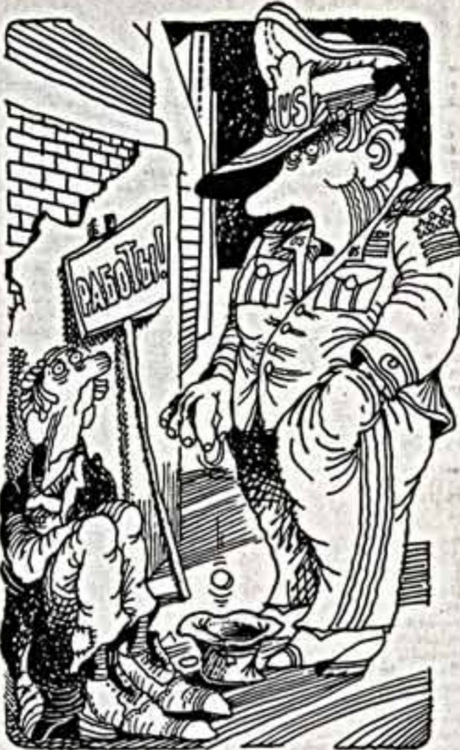
Рис. В. Арсеньева.