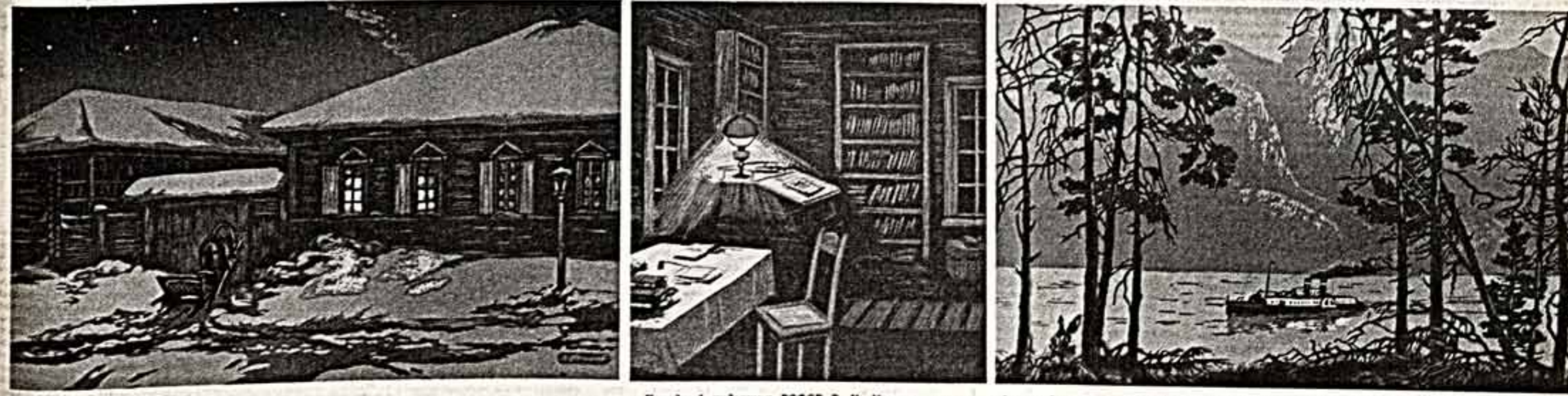
Народный художник РСФСР В. И. Метков закончил работу над серией цветных диапозитов, посвященных сибирскому селу Шушенское. С 8 мая 1897 года по 29 января 1900 года проезд в Шушенское Владимир Ильич. Это были годы напряженнейшей работы над проектами театра марксизма, критики классового бытия пролетариата. В Шушенское в те годы шла книга, журнал, газеты, повести литературы — все, необходимое Ленин для работы. Здесь было написано свыше тридцати работ: «Развитие капитализма в России», «Задачи русской социал-демократии», «Перед народническим пролетариатом», «Прогноз программы нашей партии», «Серия статей мастера из Красноярска поополит графическую Лехманну советских художников». «Почтовый гость В. И. Ленина». «Здесь работала В. И. Ленин». «На Кисее. Пароход «Св. Николай»».