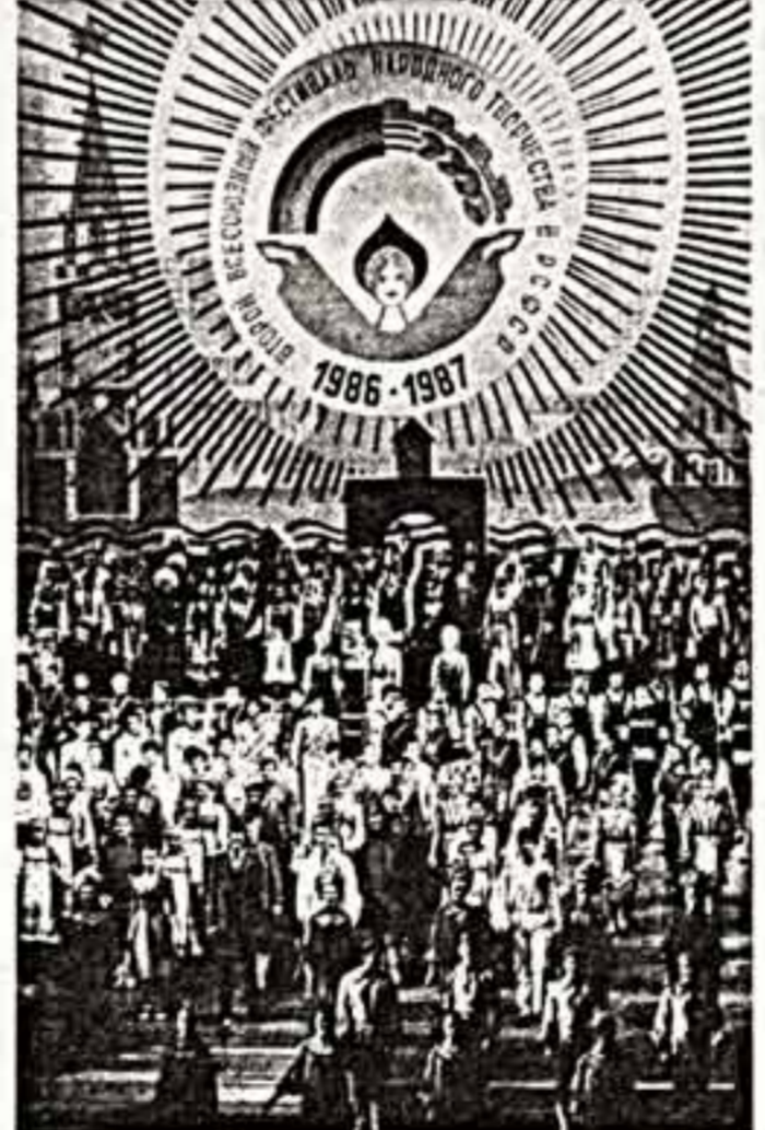
ВТОРОЙ ВСЕСОЮЗНЫЙ ФЕСТИВАЛЬ НАРОДНОГО ТВОРЧЕСТВА