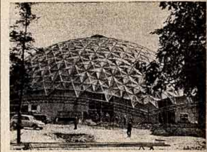
Строительство геодезического купола на американской национальной выставке в Москве.