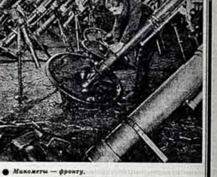
Минометы — фронт.