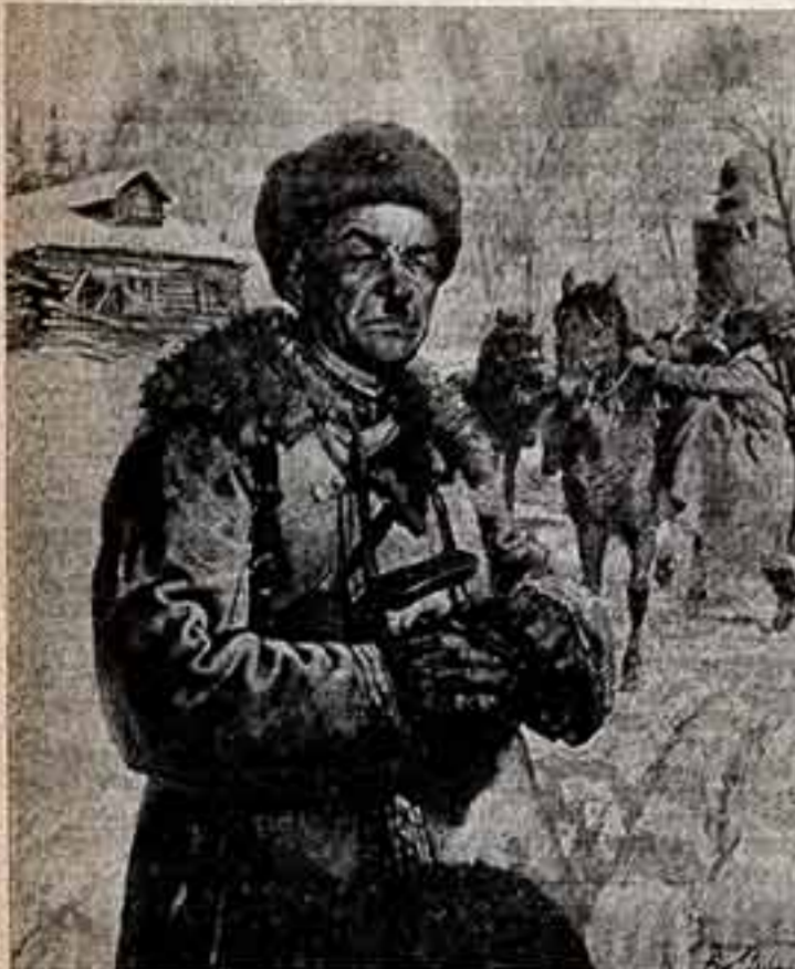
Город-герой Москва отмечает славную дату своего подвига — разгрома фашистских полчищ в сорок первом году. В эти дни в Центральной выставочной зале столицы открыта выставка «40 лет победы под Москвой». Публикуем репродукции трех работ с этой выставки.

ПО ЗАЛАМ ВЫСТАВКИ, ПОСВЯЩЕННОЙ 40-ЛЕТИЮ БИТВЫ ПОД МОСКВОЙ