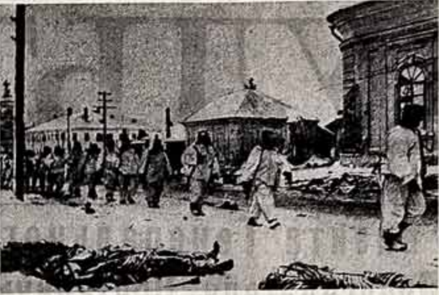
Освобожден еще один населенный пункт на Калининском направлении.