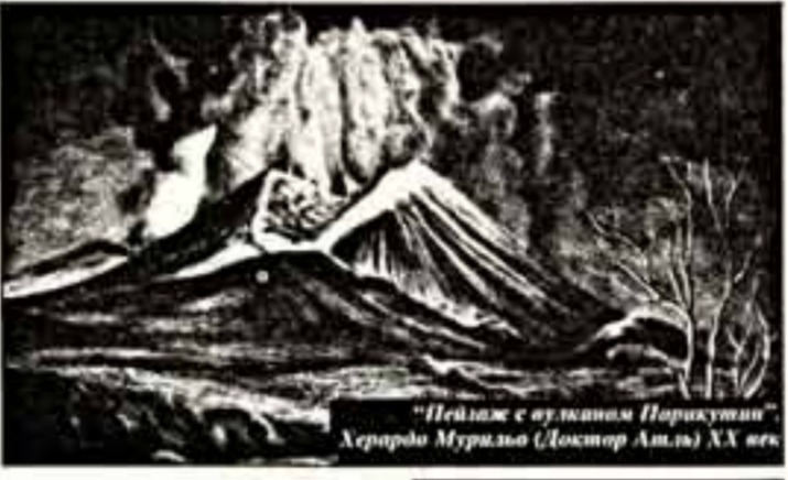
"Пейзаж с оуланом Паракатином" Херардо Мурильо (Доктор Альта) XX век

ВЕРНИСАЖ Евграф КОНЧИН Так называется выставка работ мексиканского народного искусства — изделий из серебра, керамики, дерева, тканей, скульптуры и живописи, которая открылась в Москве, во Всероссийском музее декоративно-прикладного и народного искусства.