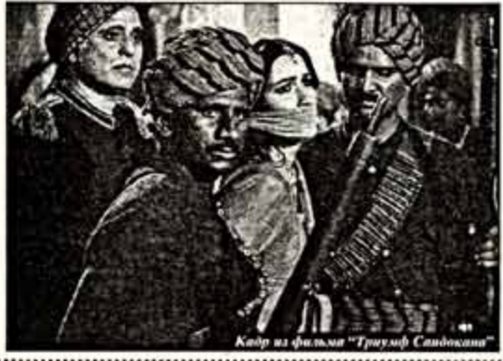
Кадр из фильма "Траумф Сандокана"