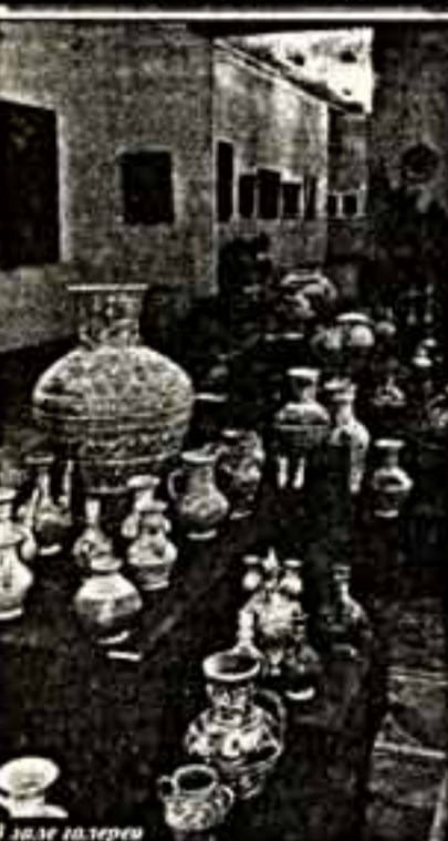
В зале галереи