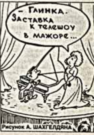
Рисунок А. ШАХТЭЛДЯНА

взвизгивающий, дергающий вас за нервные окончания). - В магазине очень хороший телевизор. - Вчера у нас испытывали новый агрегат. - Вы слышали о взрыве в метро? Кошмар! - Карпов выиграл у Гаты Камского. Посмотрим, что будет дальше... Носи каждый из нас день и ночь под мышкой роля, это было бы весело. И правдиво, то-ч-в-то-ч, как в телевизоре.