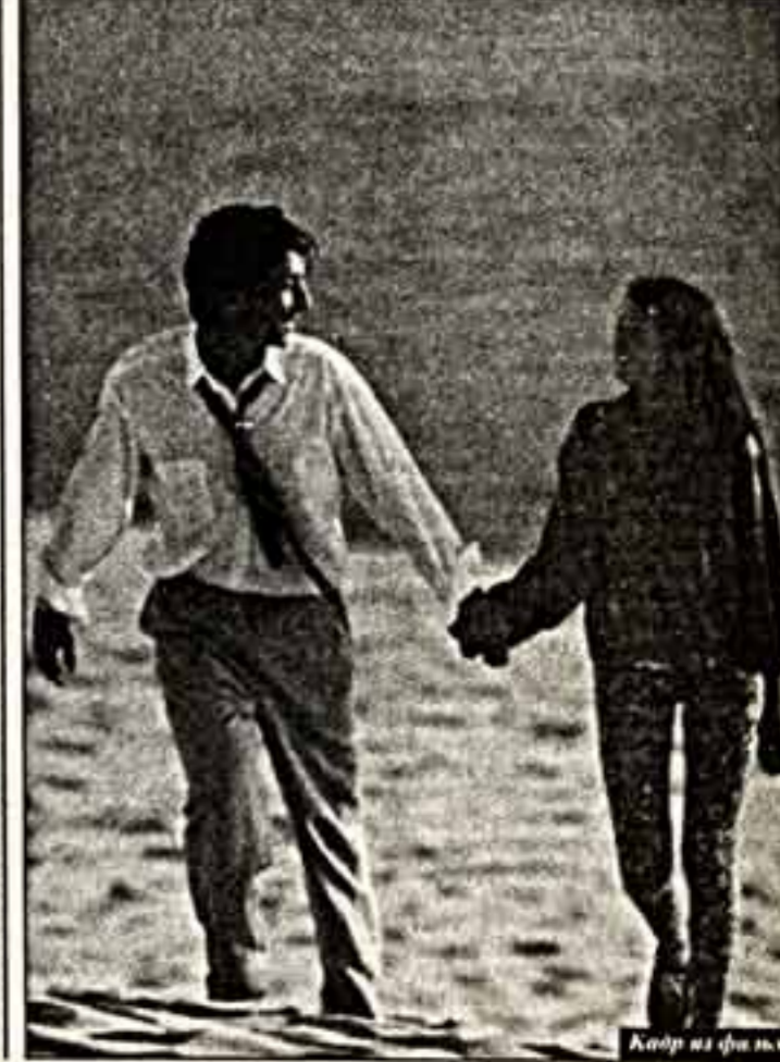
Андрей из фильма