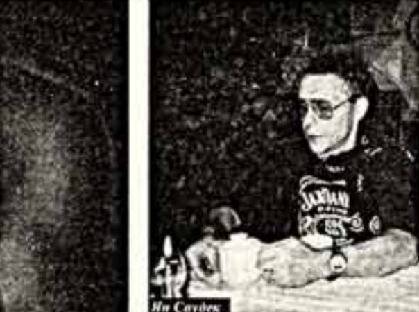
Ян Саудек. "Жизнь (Мой сын)"

створению. Я занимаюсь фотографией потому, что не могу ею не заниматься, я просто обязан заниматься своим делом. Моя творчество никому не навязывало и прекрасно то знаю, что есть люди, не принимающие его, но я не могу остановиться! — Свое призвание, насколько я знаю, вы ощутили довольно рано, когда в пятнадцать лет посетили фотовыставку Э.Штайхена "Семья человеческая". — Да, фотовыставка Штайхена оказала на меня огромное влияние. Поразило прежде всего, как много авторов приняли в ней участие. С тех пор понял главное — могу стать автором лишь камешком из той мозаики, с помощью которой человек