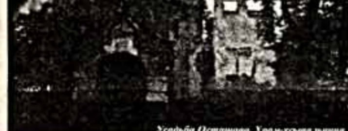
Усадьба Осташково. Гражданские войны

Чтобы "собрать" жизнь своего героя, авторам ленты пришлось проделать огромную исследовательскую работу, просмотреть километры старой кинохроники, копаться в фондах музеев и архивах. Явный гуманитарий, Константин Романов, в соответствии с традициями царской семьи, стал военистом. "Поэт-командир" прозвали его сослуживцы. Организовывал литературные вече-