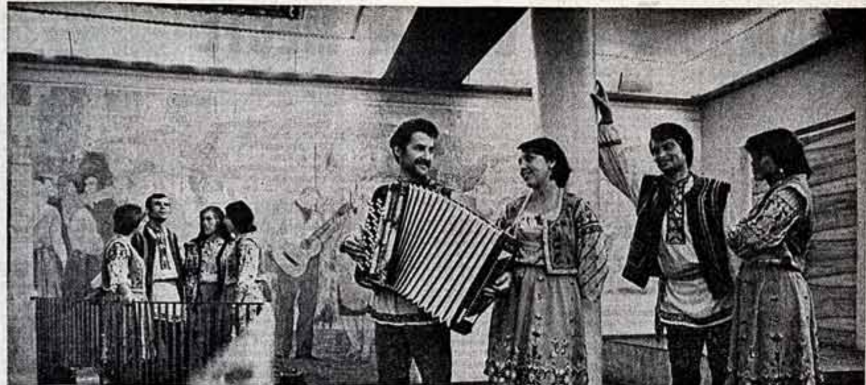
В московском колхозе «Красный садовод» вот уже несколько лет работает агитбригада. В пору уборки коллектива художественной самодеятельности разлезают с концертами по полям и полянам своего колхоза. Плодотворно поработала коллектив в период предвыборной кампании.

Если добавить к этому, что приписки в отчетных данных управления за прошлый год касались не только одной библиотеки-невидимки, но и всей городской библиотечной сети (число читателей здесь было завышено более чем на 21,500, а количество выданных книг — почти на 970 тысяч экземпляров), то станет ясным: у Бюро горкома КПСС были основания для серьезных выводов. И прежде всего, навор-