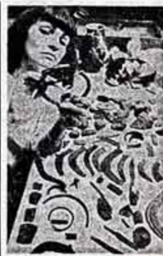
Эти древние изделия из бронзы, в которых работает древнейший реставратор Феликсатс Мюльбах, возмужают школьникам, собиравшим в лесу грибы. Советам не удалось под землей во Фридрихсберге (грод. Каланд, ГДР) обнаружить 75 предметов. Некоторые из них хорошо сохранились. Ученые датировали находку 1200—1100 годами до нашей эры.

Н. ЧИГИРЬ, корр. ТАСС — специально для «Советской культуры». ГАВАНА.