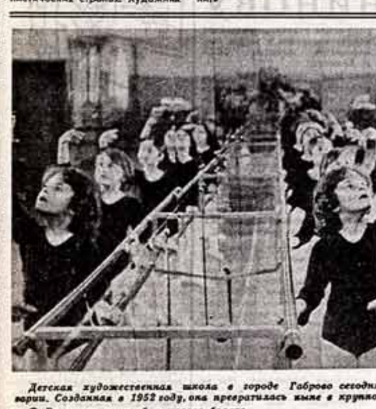
Детская художественная школа в городе Габрово сегодня хорошо известна всей Восточной Европой. В 1952 году, она превратилась в крупное учебное заведение. Во время занятий в классе балета.

Детское издательство «Мелдибукс» выпустило в свет альбом рисунков известного общественного деятеля и борца за мир, коммуниста Херлуфа Биндструпа — «Инд-78». Карикатуры, составляющие альбом, отличаются на самые жанровые проблемы и вопросы, актуальные для прогрессивного человечества. Иронией, пронзительными, разоблачающими клеветническую кампанию западной пропаганды по поводу мнимых нарушений прав человека в социалистических странах. Художник