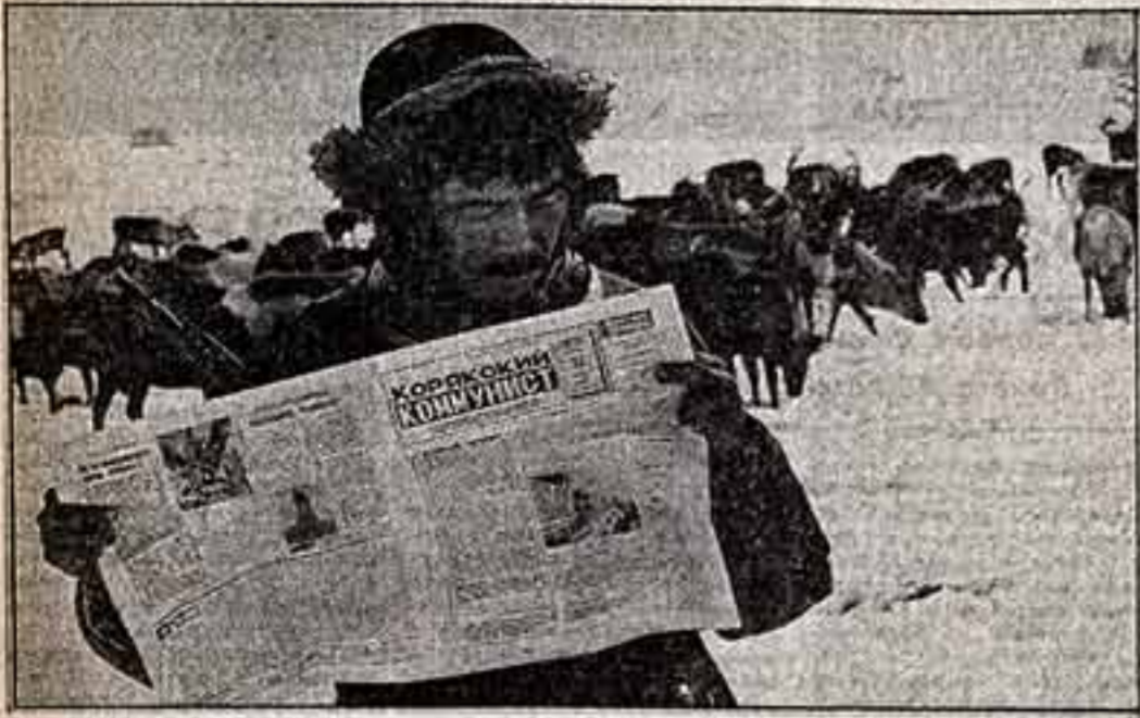
ФОТОКОНКУРС А. ГУЩИН. «В тундру пришла почта» в «Бесполойное хозяйство Камчатки».