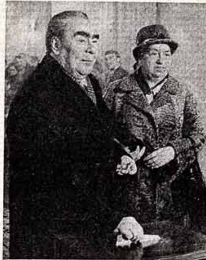
Москва, 4 марта. Товарищи Л. И. Брежнев и А. И. Косыгин на избирательных участках.