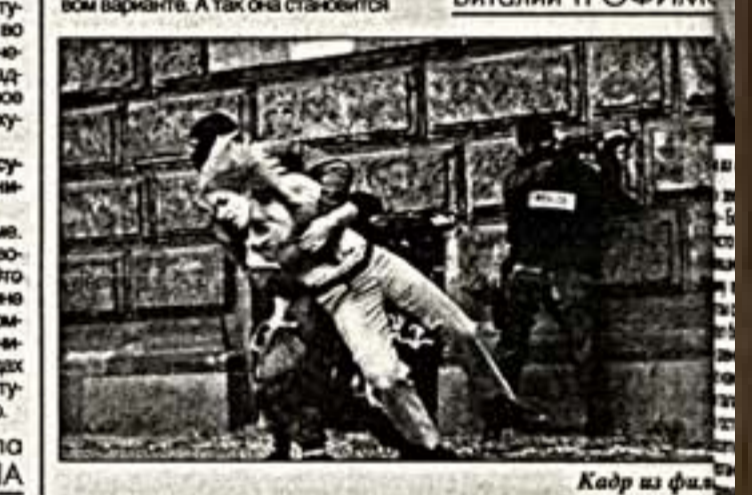
Кадр из фильма "Беги, Лола, беги!"

Срок лет назад фильм испанского режиссера Педро Альмодовара "Беги, Лола, беги!" заставил меня задуматься о жизни. Вспомнил о том, как начинал свою жизнь в Испании, о том, как начинал свою жизнь в Испании, о том, как начинал свою жизнь в Испании. Вспомнил о том, как начинал свою жизнь в Испании, о том, как начинал свою жизнь в Испании. Вспомнил о том, как начинал свою жизнь в Испании, о том, как начинал свою жизнь в Испании.