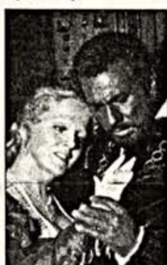
Пласидо Доминго - Отелло

"Я бы хотел выступать на сцене с полной отдачей по меньшей мере еще пять лет. Кроме того, в профессиональном плане..."