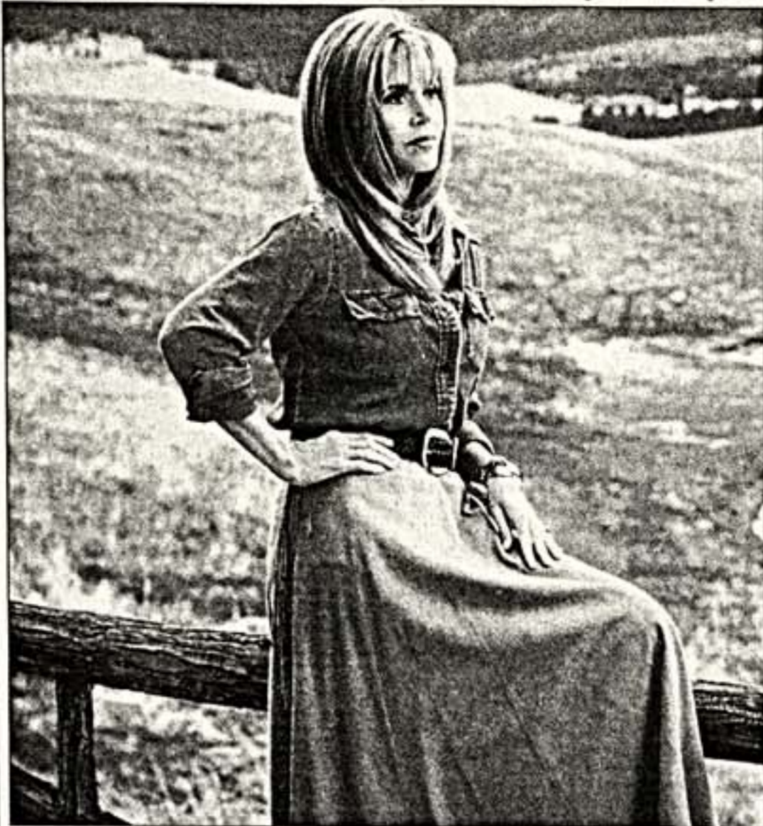
Дж. Фонда на своем ранчо

Суперзвезда после развода перед новым стартом