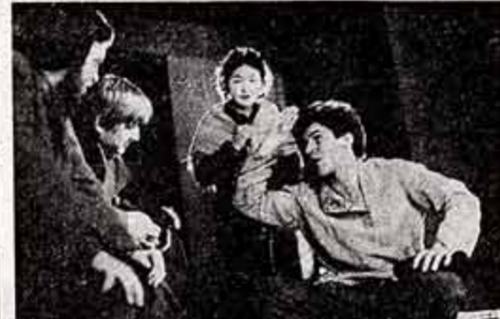
В Алтайском государственном институте культуры на театральном отделении готовят руководителей самодеятельных драматических коллективов. Студенты репетируют спектакль «Власть тьмы».