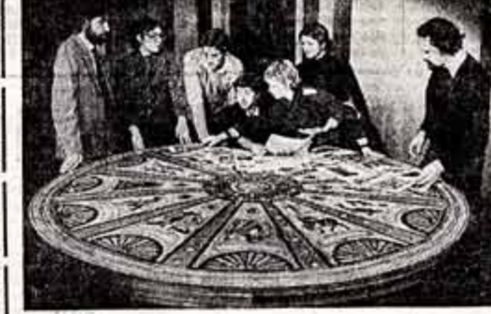
Художественно-графическому факультету Омского педагогического института имени М. Горького — 20 лет. Большинство воспитанников факультета работает в школах Сибири, многие из них стали художниками. На семинаре по истории искусства.