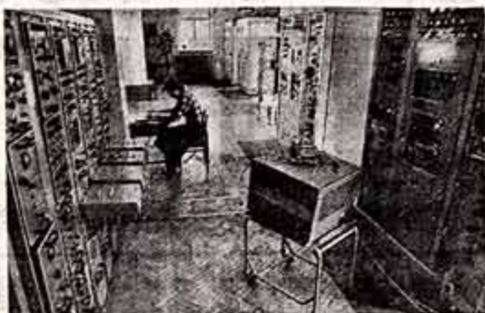
Деятели процентов жителей Иркутской области даже в самых отдаленных районах могут принимать теперь программы Центрального телевидения в черно-белом и цветном изображении. В аппаратурном цехе радиокоротковолновой станции радиопередающего центра.