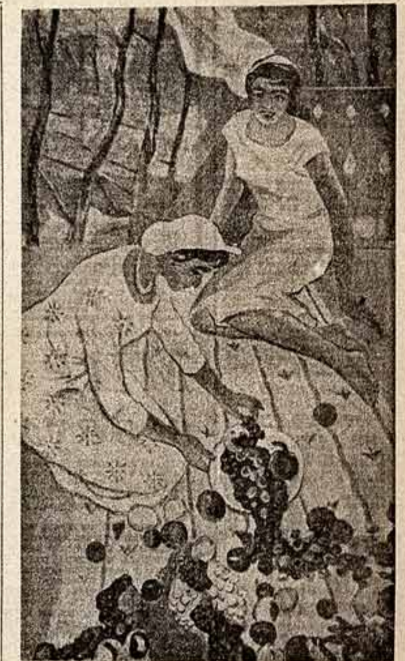
М. Григорян (Армянская ССР) «ОСЕНЬ».