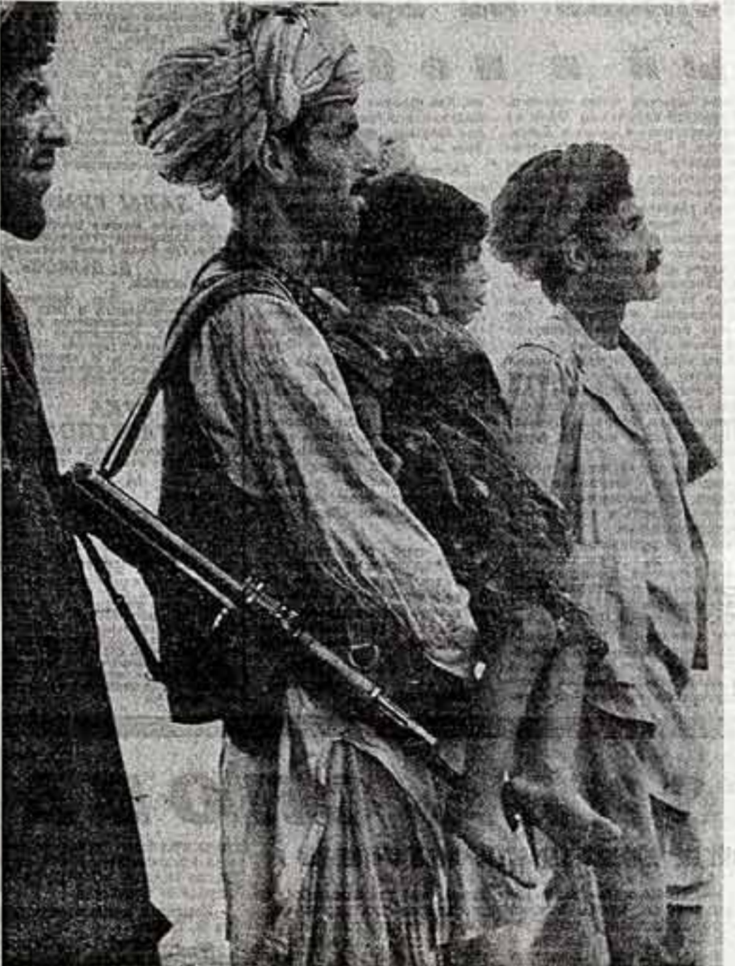
И. КУДРЯШОВ. «Азия — сегодня».