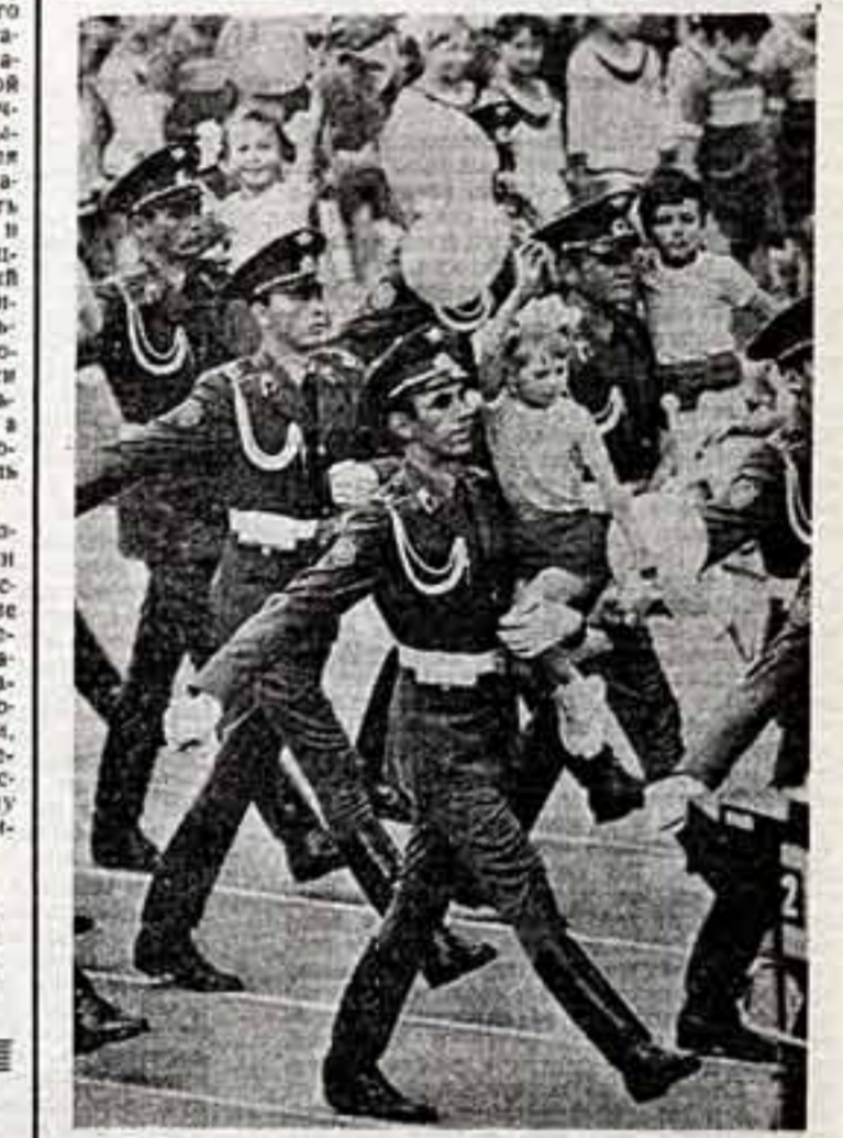
Б. БАБАНОВ. «Защитники». П. КАСНИН. «До свадьбы».

Секретариат правления Союза кинематографистов СССР обсудил задачи творческого союза по выполнению постановления ЦК КПСС и Совета Министров СССР «О мерах по дальнейшему повышению идейно-художественного уровня кинематографии и укреплению материально-технической базы кинематографии». Было подчеркнуто, что постановление является для искусства историческим документом, долговременным программой нового этапа развития советской кинематографии. Определены конкретные мероприятия в свете задач, вытекающих из постановления.