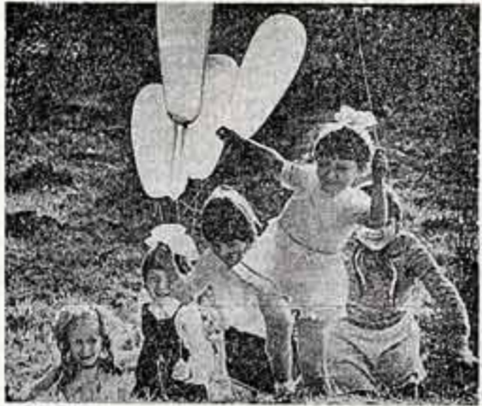
Ю. ПОДКИДЫШЕВ. «Первомай». (На сцене «Детство мое, посмей!»).