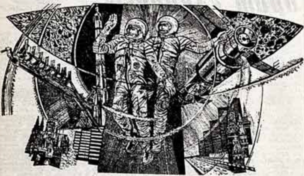
Гравюра художника Н. Смак (ЧССР), посвященная торжеству пролетарского интернационализма, единства и сплоченности стран социалистического содружества.