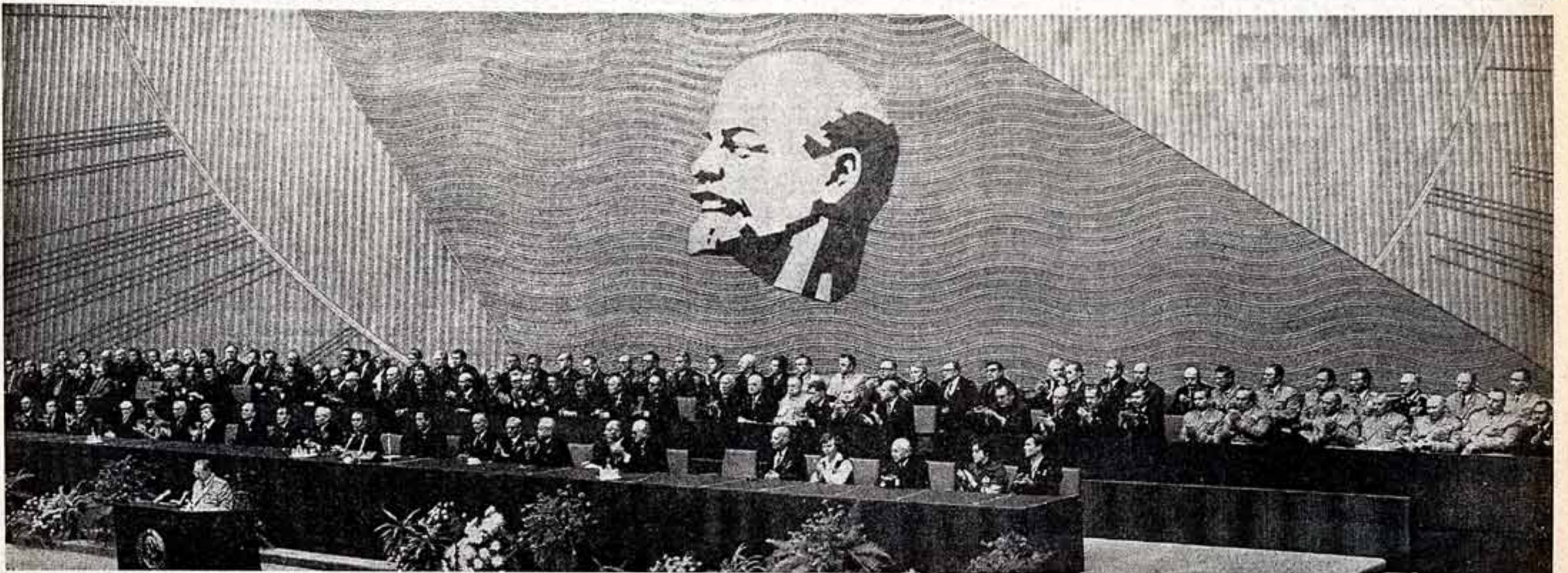
Кремлевский Дворец съездов. В президиуме торжественного заседания.