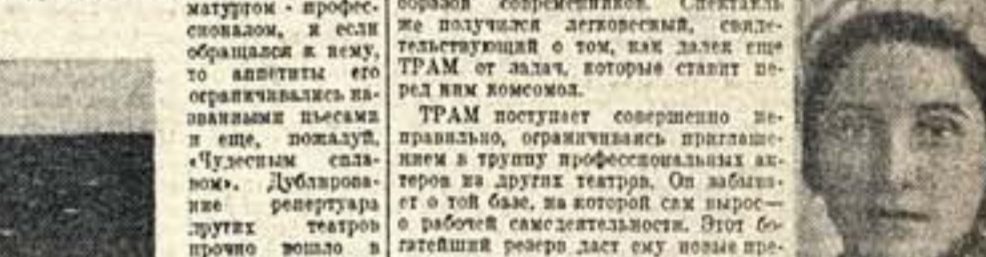
Соплистка балета Большого театра СССР О. Гурьян