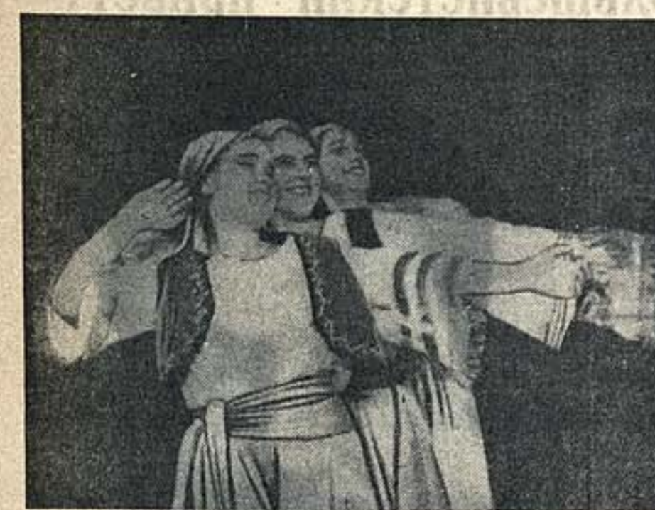
Хореографическая школа на Московском автозаводе имени Сталина...