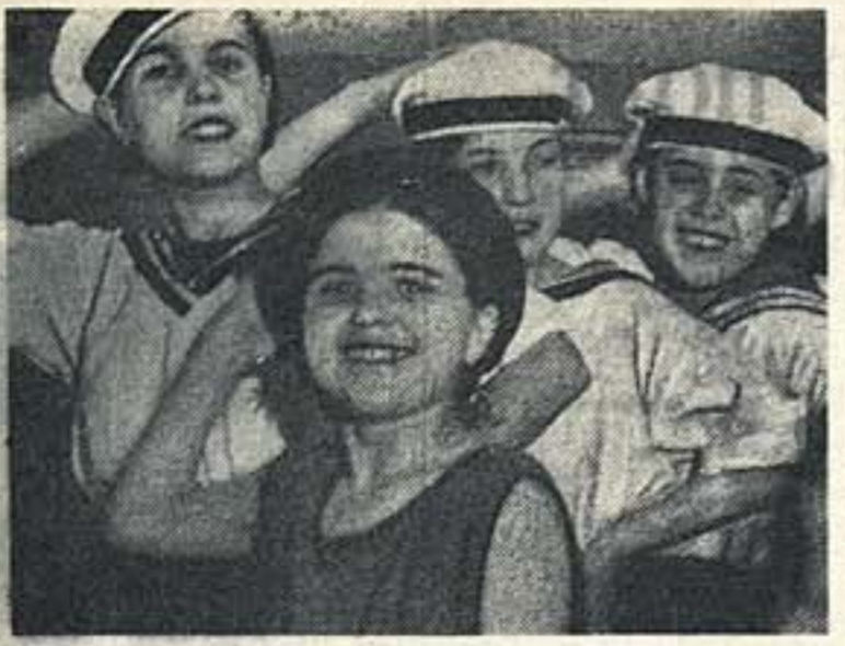
«Переводка» в Театре народного творчества. Матросский танец